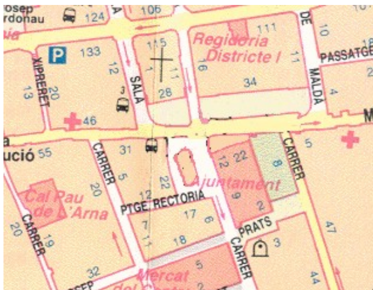
Figura 2. Detall d'ubicació de la Plaça de l'Ajuntament i la Plaça de Mossèn Homar en la xarxa urbana de L'Hospitalet (Ajuntament de L'Hospitalet, escala 1:2000 –imatge ampliada proporcionalment-).

L'obra d'enginyeria implicava l'excavació de la pràctica totalitat de la superfície de la plaça gran, amb una potència que ultrapassava sobradament l'estratigrafia sedimentaria d'origen quaternari, en un indret on, s'afectaven la totalitat de les restes identificades de la vella església de Sta. Eulàlia de Mèrida (s.XVI-XVII), la seva sagrera i necròpoli associada i la prèvia àrea cultural, amb