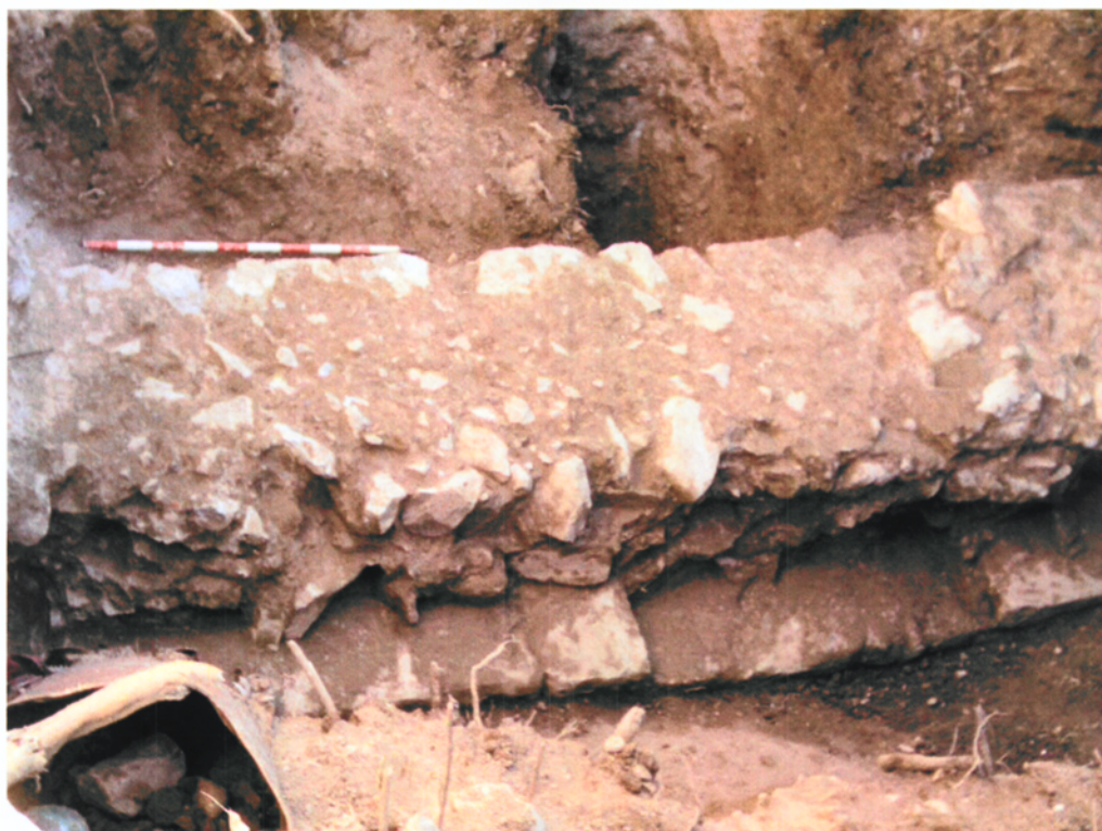
Dues vistes generals del tram de muralla, des del sud-oest (foto superior) i des del nord-est (foto inferior).