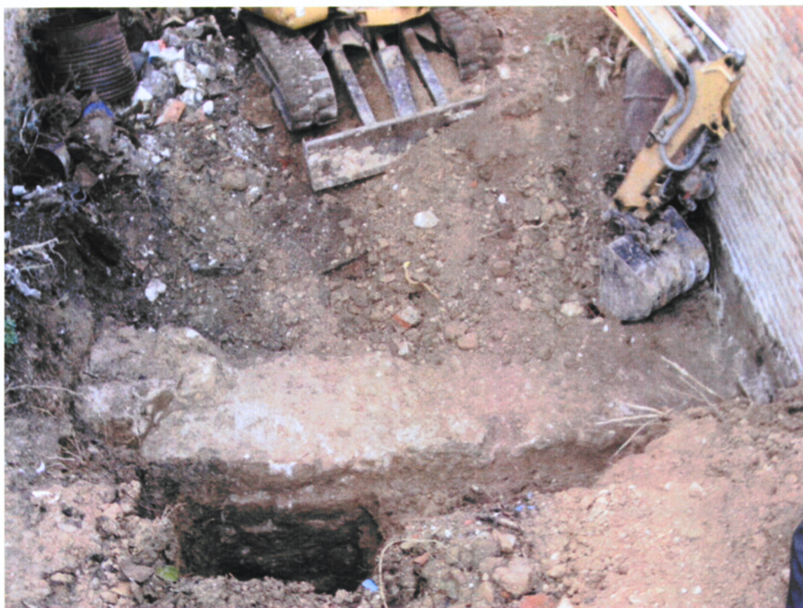
Vista general d'un moment dels treballs de delimitació de la muralla.