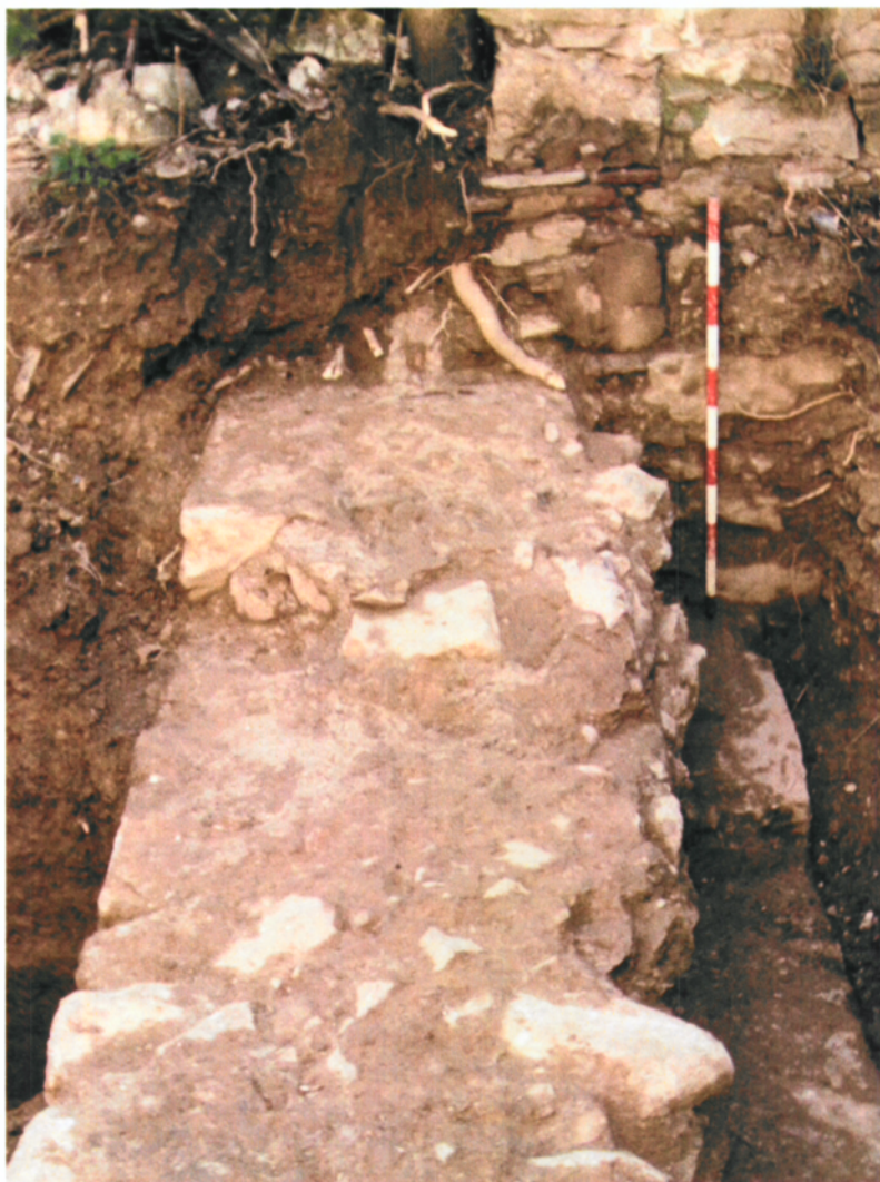
Detall de la fonamentació de la casa veïna, recolzada sobre la muralla baix-medieval.