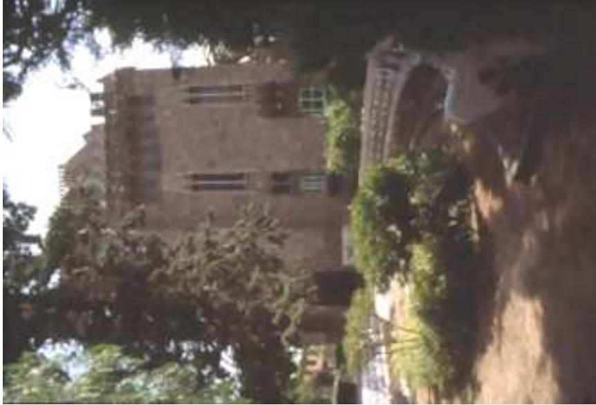
Vista façana principal