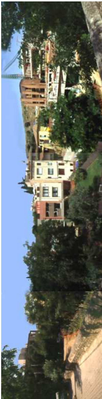
Panoràmica entorn en direcció oest