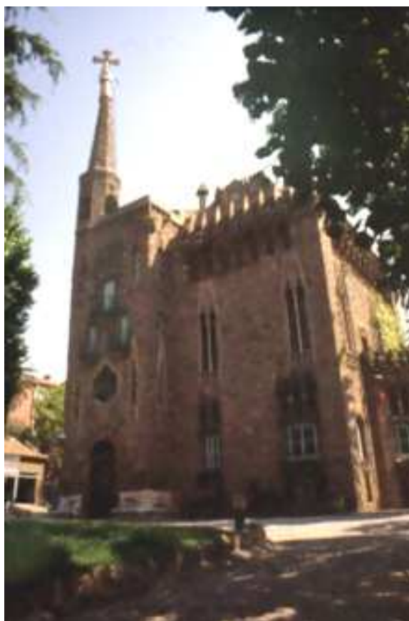
Torre Figueres. Porta d'entrada a la finca