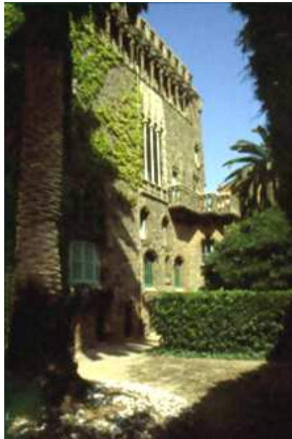
Vista façana sud