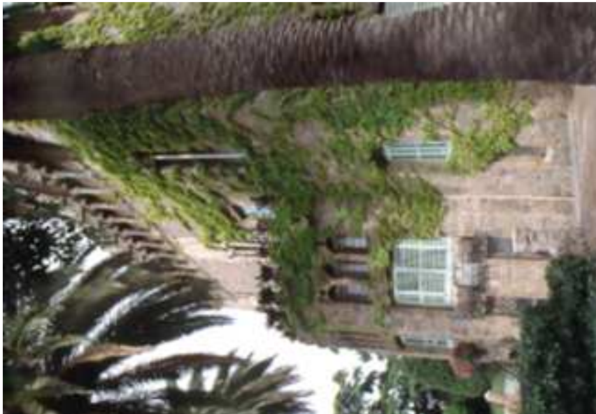
Vista façana sud