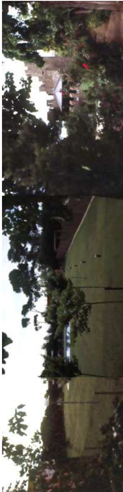
Panoràmica entorn en direcció sud-est