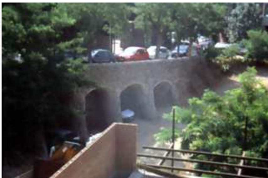
Vista al nord-oest des del pavelló situat a l'entrada de la finca