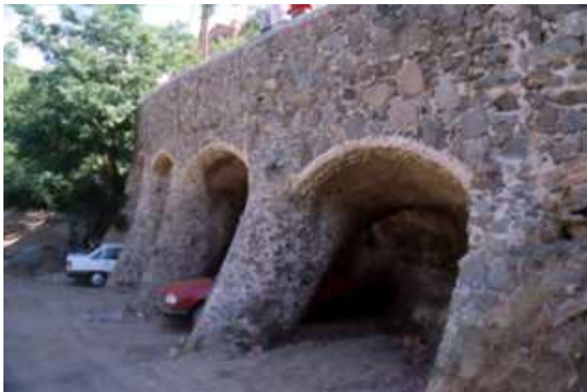
Viaducte sota el carrer de Bellesguard en direcció sud