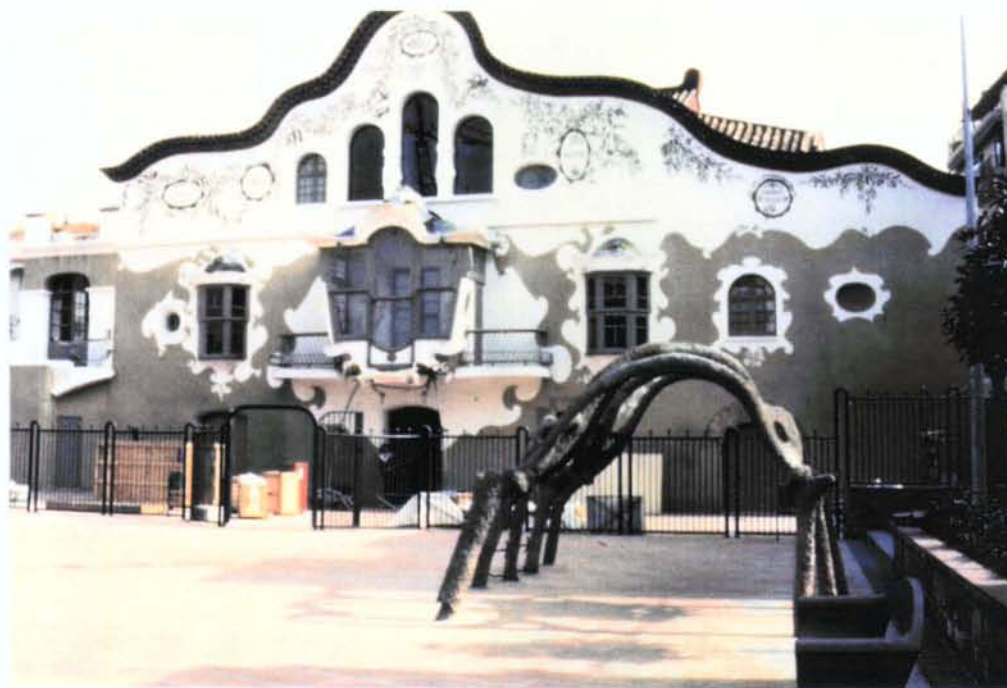
2. Façana principal amb la glorieta d'arcs arriestrats al davant