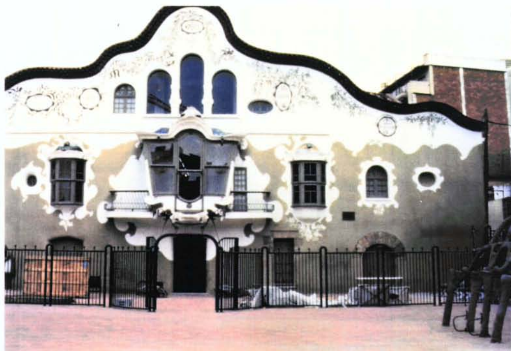
1. Façana principal