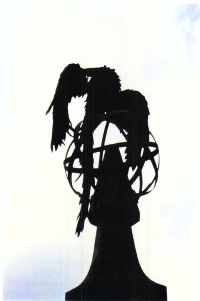
10. Detall de forja