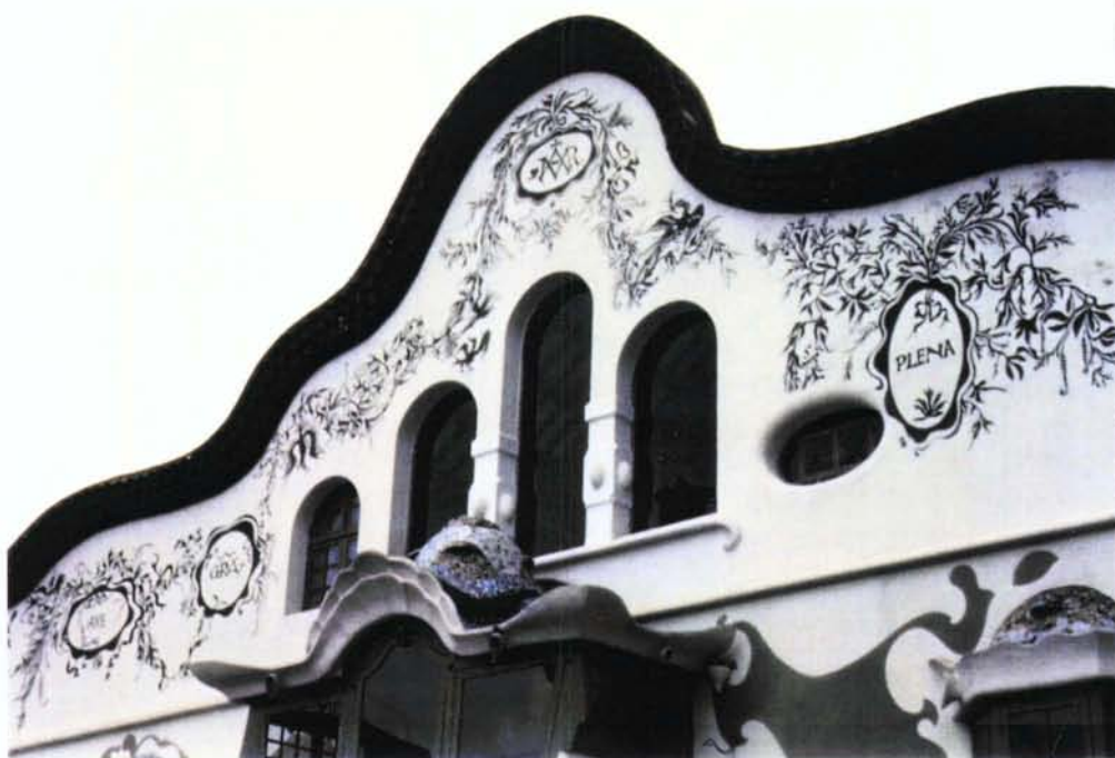
3. Detall coronament façana