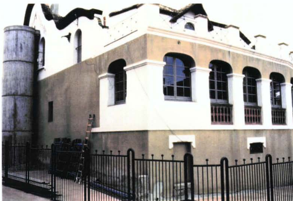
5. Façanes posterior i lateral