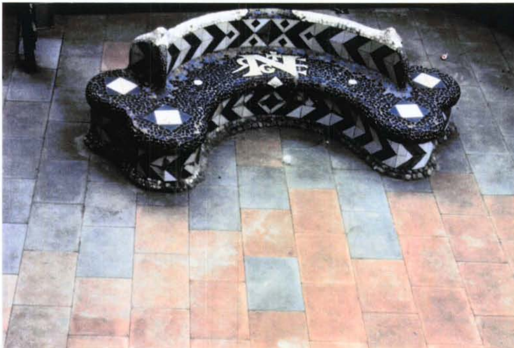
8. Banc de trencadís