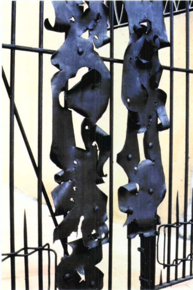
9. Detall de forja