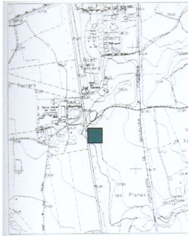
Situació del jaciment de can Terrés (La Garriga, Vallès Oriental).

L'accés al jaciment s'efectua per la carretera N-152 de Granollers a la Garriga. Passat el punt quilomètric 36, la carretera travessa el torrent esmentat, el qual és paral·lel al camí veïnal anomenat també de Malhivern. Aquest camí dona accés directe a la part excavada del jaciment, actualment visitable. El jaciment rep el nom de can Terrés per la proximitat de la masia del mateix nom, situada a l'oest de les restes.