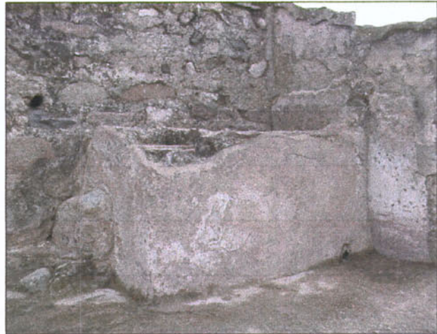
Dipòsit: Bd 1

Una altra de les accions portades a terme fou la neteja de les parets que presentaven taques de fongs i concrecions calcàries. Les parets netejades van ser: B3, Bd 1 i Bd 2, així com l'interior de la piscina freda.