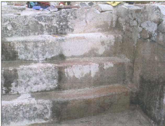
Frigidarium: graons, C3