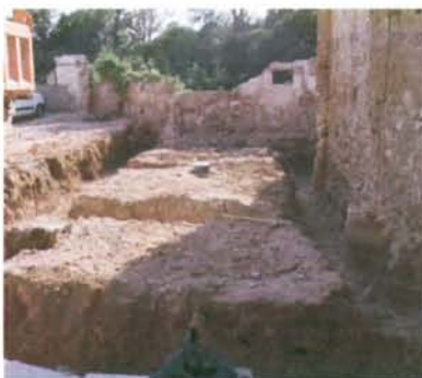
7.- Vista fonaments des del carrer del Pont