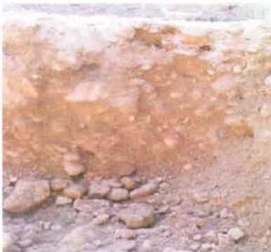
5.- Tall sabata fonamentació