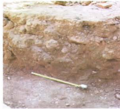
4.- tall sabata fonamentació