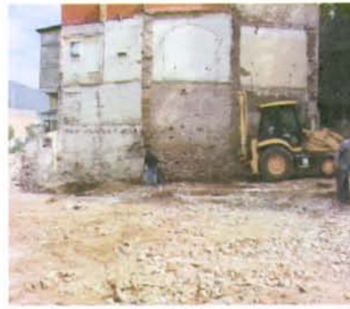
2.- Inici obres