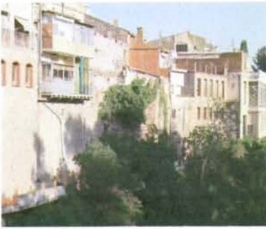
1.- Vista des del Pont