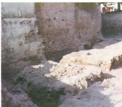
8.- Vista fonaments des de l'interior de la parcel·la