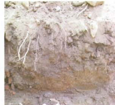
6.- Tall salbata fonamentació