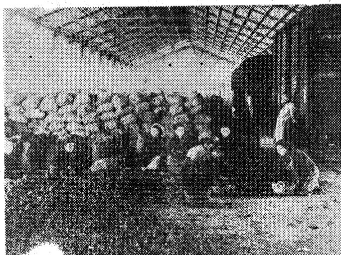
En el muelle de Cartagena se han desembarcado mil toneladas de patatas procedentes de Inglaterra y que se distribuirán entre los agricultores españoles para la siembra