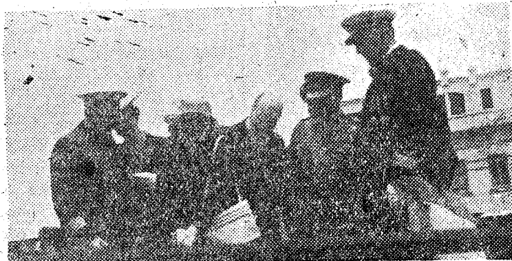
S. E. el Jefe del Estado, acompañado de los ministros de Marina e Industria y Comercio lo realiza una visita a los astilleros de la Unión Nav al de Levante, en Valencia