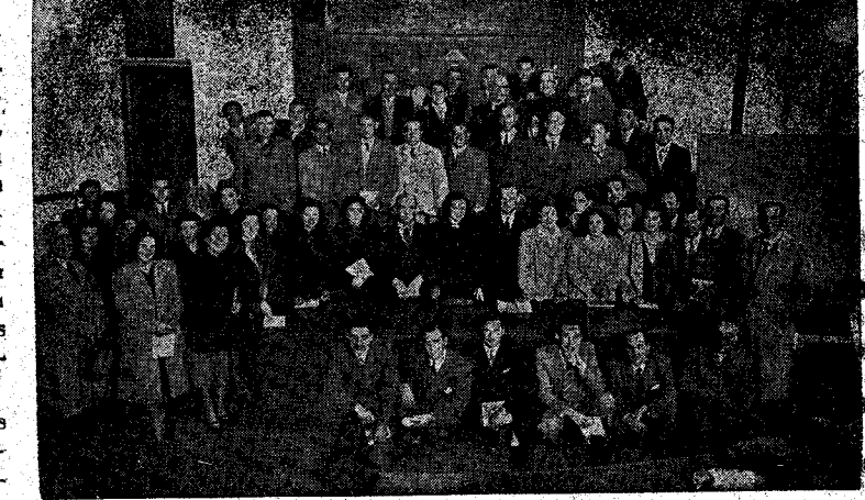
Asistentes a uno de los Cursillos de Capacitación nacionales, donde nuestros representantes obtuvieron la máxima puntuación