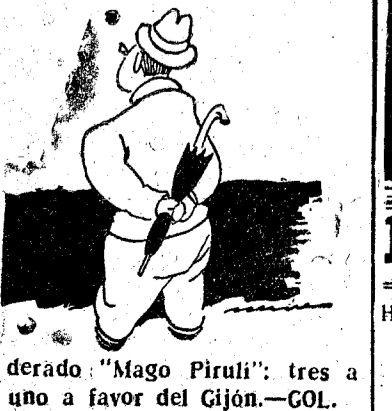
derado "Mago Piruli": tres a uno a favor del Gijón.—GOL.

Y ahora el pronóstico infalible, oportuno y señero del pon-