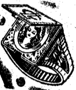
Modelo 20. A

SORTIJA PLATA DE LEY CON PIEDRA AGUA MARINA o con foto microesmalte en técnico y letras grabadas, recibirá como propaganda bonito regalo. Envíen fotografía (cuálquier tamaño), iniciales y medida (una tira de papel) a