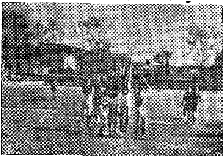
Los jugadores del G.E. y E.G. protegen su portería de un golpe franco barcelonés. Obsérvese que levantan los brazos para cubrir mejor la zona de peligro.

el balón a mano cuando lo practican hombres a él entregados. El partido en sí poca historia tuvo. La superioridad barcelonesa anuló cualquier resistencia contraria y por esto la lucha se limitó a un insistente forcejeo entre el saber de unos y la voluntad de otros. El marcador só-