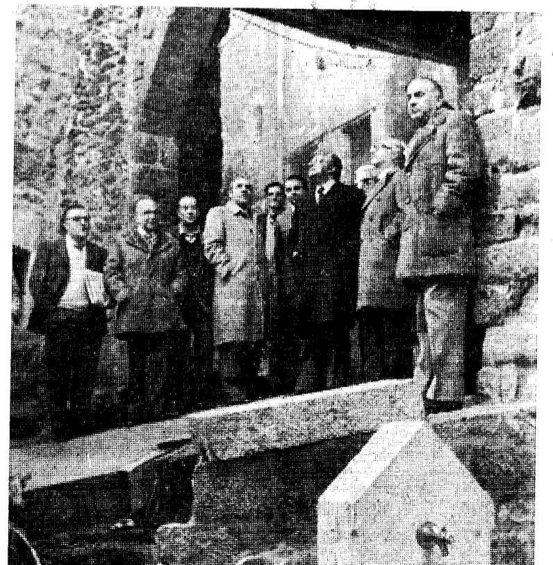
Ayer, el Gobernador Civil, con el delegado del Ministerio de Cultura y representantes de la Dirección General del Patrimonio Artístico, estuvieron en Santa Pau para examinar la marcha de los trabajos de restauración y recuperación de aquel conjunto medieval en el que la Administración invierte 24 millones de pesetas. (Foto Pablito).