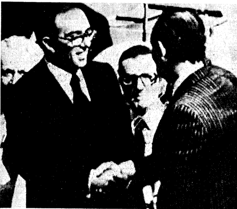
Madrid, 12. — (Pyresa). — Marcelino Oreja, Ministro español de Asuntos Exteriores, visitará Moscú del próximo día 17 al día 20. Se trata de la primera visita oficial que un Ministro de Asuntos Exteriores español realiza a la Unión Soviética. (Pasa a la pág. siguiente).