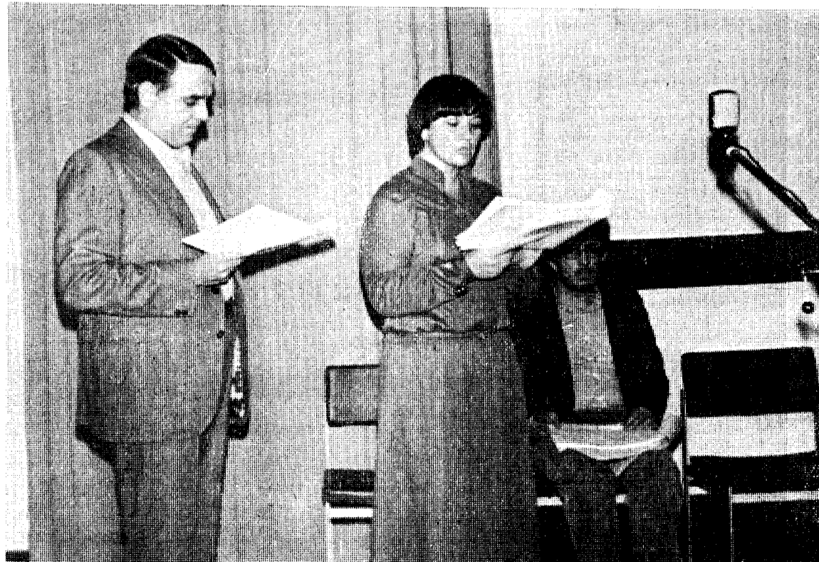
Un singular montaje escénico a cargo del «Grup Proscenium» se presentó en la Casa de Cultura con una evocación del «Breviari de Ciutadania», de Carles Rahola, un texto que mereció, en 1933, el Premio de la Generalitat de Catalunya para un escrito que evocase el momento político e histórico de nuestro país, por tantos aspectos semejante al actual. A través de este montaje, se quiso recordar ahora las palabras de Rahola, con válida permanencia: «Catalunya, amb les llibertats que li han estat reconegudes, será un gran poble que, tot recordant la seva història, es farà digne d'un esdevenidor gloriós». (Foto Pablito).

C/. Platería, 9 — Telf. 20 25 36 — GIRONA