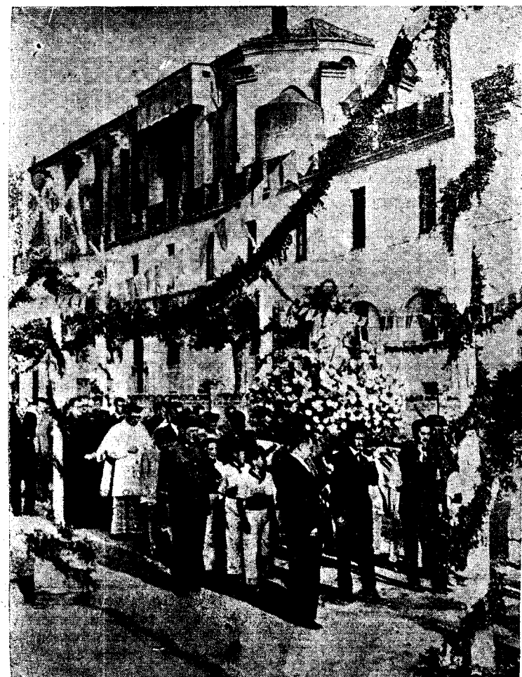
Como a Señora, Reina y Madre, la imagen de María Auxiliadora es paseada en triunfal procesión por los patios y jardines de la Granja Salesiana. El objetivo de Fagnoli-Castro nos ofrece la visión de un momento del brillante desfile. (Información en segunda página.)