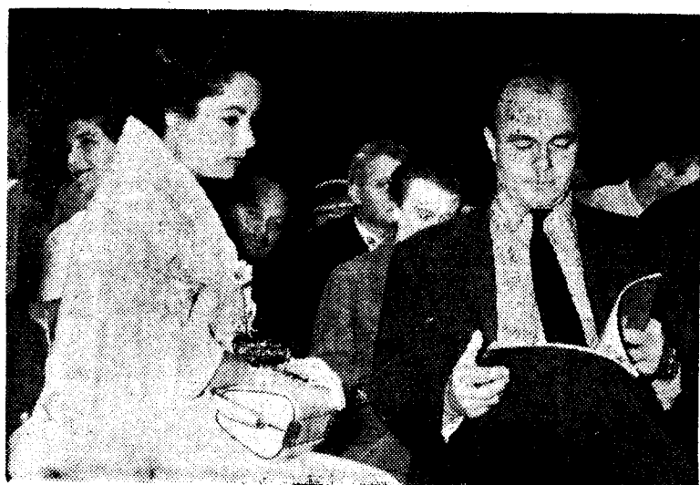
PARIS. — Una colección de cuadros, pertenecientes al príncipe Alí Khan ha sido vendida en subasta en una Galería de Arte de París. Al príncipe le vemos aquí examinando el catálogo. A su lado, Elizabeth Taylor.