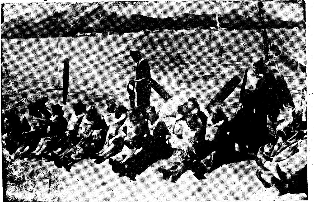
PALMA DE MALLORCA. — He aquí a los pasajeros del hidroavión de la línea Mallorca-Southampton subidos en las alas en espera de ser trasladados a tierra en lanchas de salvamento. El aparato, al despegar de la bahía de Pollensa sufrió unas averías y chocó con unos escollos, inundándose inmediatamente la cabina. Los trabajos de salvamento se realizaron con toda rapidez y en 20 minutos los 57 pasajeros fueron puestos a salvo. Esta fotografía fue obtenida por uno de los pasajeros.