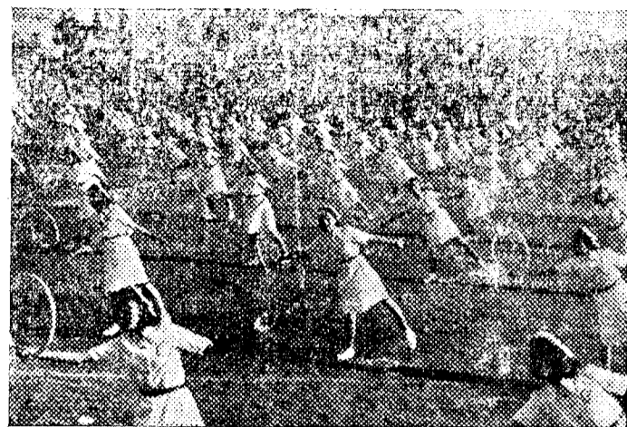
La Falange tiende a una juventud sana y fuerte, mediante el fomento de la educación física