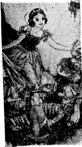
Blanca Nieves, con el gozo adolescente de los siete enanitos, llega a nuestra ciudad en días de ilusión y de infancia