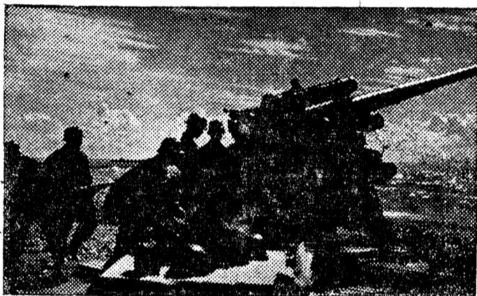
La artillería pesada germana apunta al canal de la Mancha