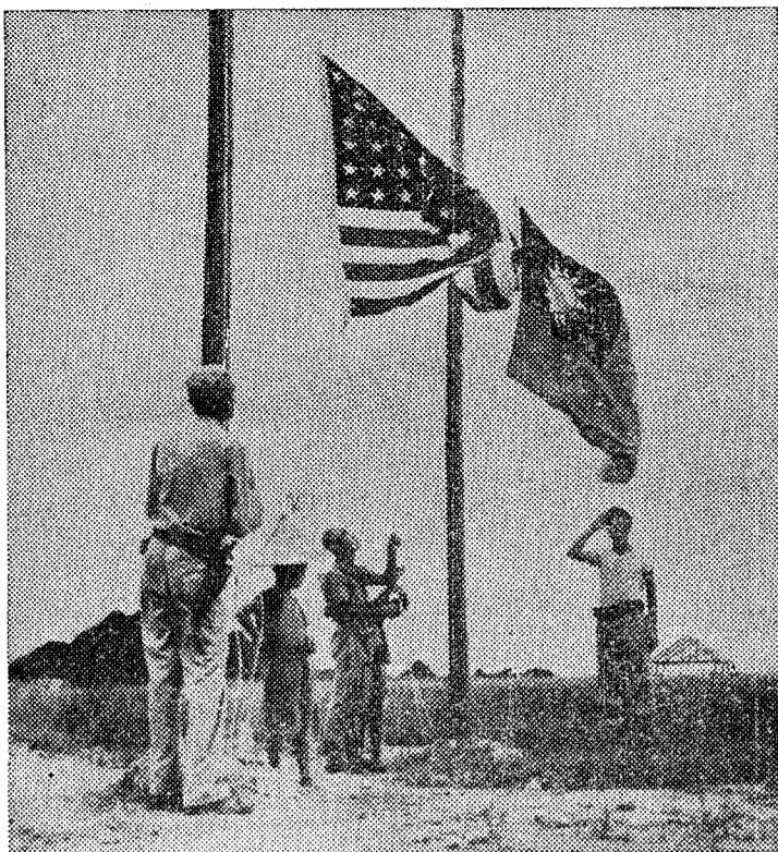
Las banderas norteamericana y china se izan en la ciudad de Linchow, al sur de China