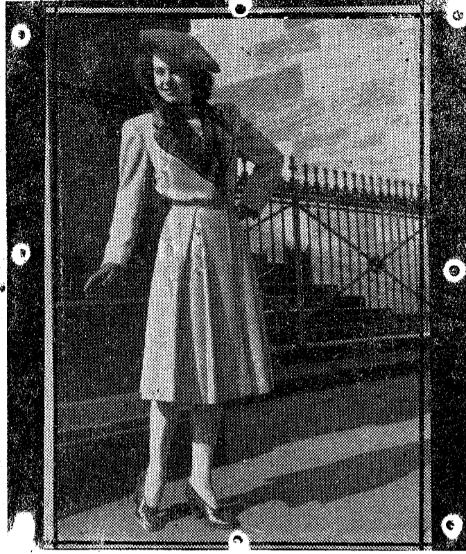
He aquí un modelo que se llevará el próximo otoño. Nosotras, revisores, nos anticipamos a mostrarlo a nuestras lectoras para que puedan ser las primeras en lucirlo, preparando y tomando nota de este elegante abrigo de lana esponjosa gris claro con corte deportivo y las solapas de marfil.