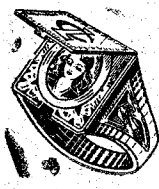
Modelo 20. A

SORTIJA PLATA DE LEY CON PIEDRA AGUA MARINA o con foto microsmalte en técnico y letras grabadas, recibirá como propaganda bonito regalo. Envíe fotografía (cualquier tamaño), iniciales y medida (una tira de papel) a ESTUDIOS AMERICA. Apartado 12266. Única Casa que garantiza el envío (sin cupones ni engaños). Plazo de entrega, ocho días. Necesitamos representantes