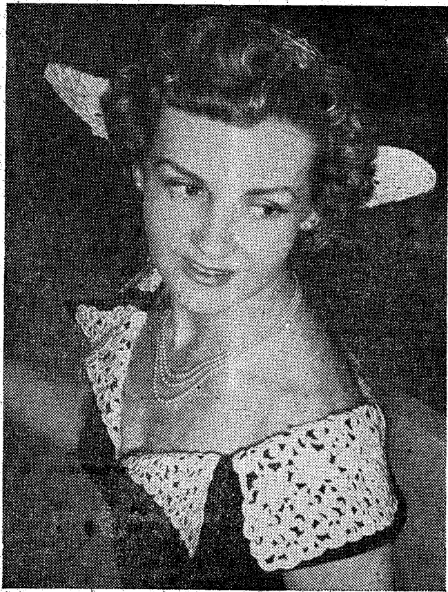
Traje de crepón de lana azul marino con cuello de encaje de oro. Sombrero muy original de reciente creación. (Ca'pe)

EMPRESARIO! Colaborarás a la unión espiritual de todos los españoles si solicitas el "Pago autorizado", entregando directamente a tus trabajadores, junto con el salario, el Subsidio Familiar que les corresponde.