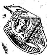
Modelo 20. A