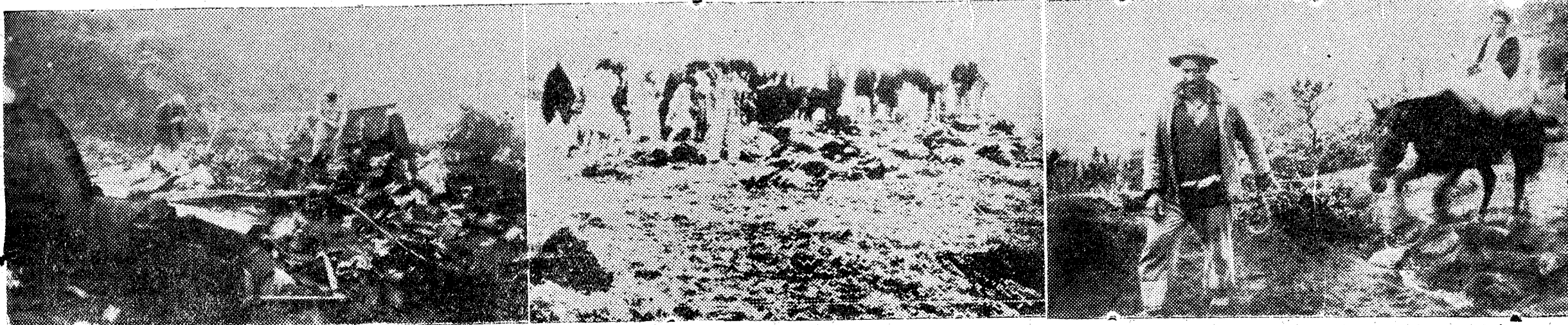
1. Impresionante fotografía del estado en que quedó el "Constellation" en su choque contra la montaña, y en cuyo accidente perecieron el boxeador Cerdán, la violinista Neveu y los demás pasajeros y tripulantes del avión.—2. Otra fotografía, ésta recibida por radio, del accidente de aviación de las islas Azores.—3. Al momento de tenerse noticia del trágico accidente, grupos de campesinos de las localidades próximas acudieron al lugar de la catástrofe, con sus mulos, para realizar la búsqueda de los cadáveres entre los restos del avión.