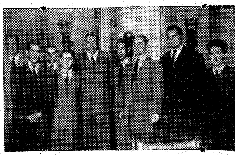
Una comisión de alumnos del quinto año de Derecho durante el acto de entrega al ministro de Asuntos Exteriores del nombramiento de Padrino de la Promoción de la Facultad

Clay ha llegado a esta ciudad para participar en la inauguración de la campaña para obtener fondos con objeto de luchar contra el artrismo. — Efe.