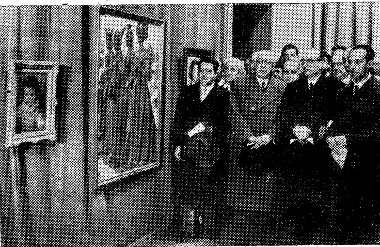
El ministro de Educación Nacional, acompañado de otras personalidades, durante el acto inaugural del Salón de Otoño, en el Museo de Arte Moderno

Washington, 21. — El Episcopado norteamericano ha publicado una declaración poniendo en guardia al mundo occidental contra las amenazas que pesan sobre la vida familiar. Dicha declaración ha sido publicada al terminar la reunión anual de los obispos, y en ella se dice, entre otras cosas: "El mundo occidental proclama la dignidad humana, pero al mismo tiempo trata al hombre, físicamente, como producto de la evolución mecánica y materialista. Trata de considerar cada vez más al hombre, desde el punto de vista social, como individuo al servicio del Estado o de los grupos dominados por el Estado. Se trata de destruir la vida familiar y el hogar desde el momento en que aprueba y felicita el divorcio como una cura para las enfermedades humanas y acepta los casamientos múltiples. Actúa así, dominado por una corriente de degradación moral." — Efe.