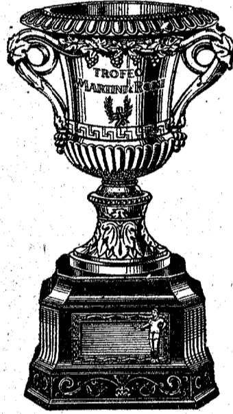
TROFEO MARTINI & ROSSI

El paso del primer corredor queda pues previsto como sigue: Bañosas 8 h. 27 m., Besalú 8 h. 48 m., Figueras 9 h. 26 m., Girona 10 h. 22 m., Cassá 10 h. 42 m., S. Feliu 11 h. 10 m., Palamós 11 h. 23 m., La Bisbal 11 h. 43 m., Girona 12 h. 11 m.