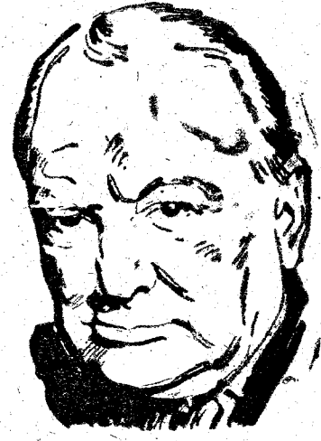
En todo el mundo contra todas las formas existentes de civilización sea necesariamente un signo de peligro.

La Haya, 14. — La princesa Juliana de Holanda ha prestado juramento como Regente del Reino de los Países Bajos, ante los miembros de las dos Cámaras. La sencilla ceremonia se ha efectuado a las tres de la tarde (hora local). — Efe.