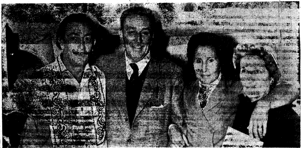
El genio Walt Disney ha pasado unos días en Cadaqués, invitado por Dalí. Parece ser que Disney y Dalí proyectan realizar una película en la que fundirán sus genios. En la fotografía, y de izquierda a derecha, los señores a Dalí luciendo, además de sus bigotes un poco alcaídos, una extravagante camisa; Walt Disney; María Gala, la esposa de Dalí, y la señora de Disney.