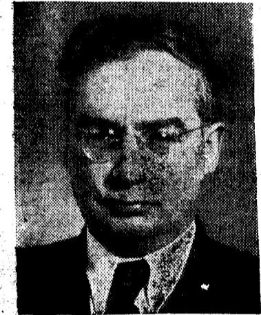
Este es Leonidas Sedov, especialista soviético en astronáutica, que dirige el equipo de científicos que han elaborado el famoso satélite. Se encuentra en Barcelona, donde participa en los trabajos del VII Congreso Internacional de Astronáutica.