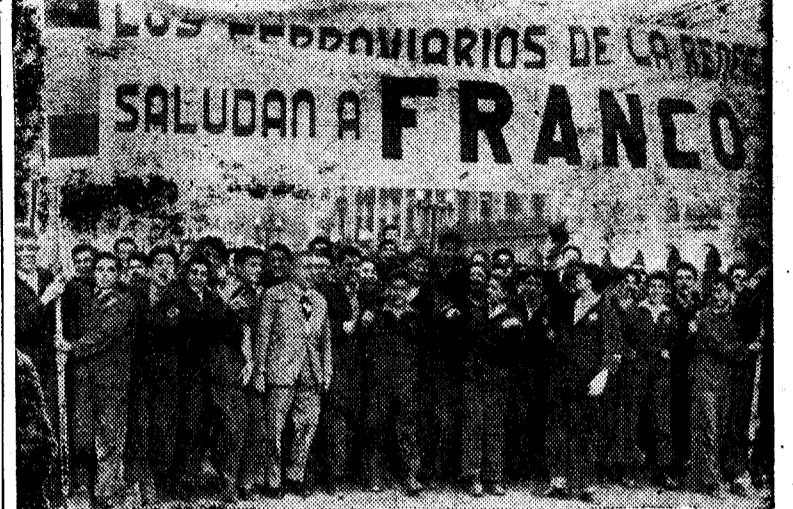
Tres aspectos del apoteósico recibimiento que Barcelona entera tributó a S. E. el Jefe del Estado, Generalísimo Franco, donde fue saludado primeramente por las autoridades, y aclamado luego por la gran multitud que le vitoreó a su paso por las calles barcelonesas