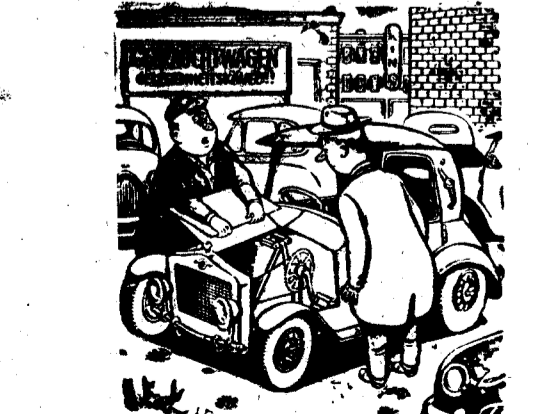
—¿Por ese precio no puede darle otra cosa...!