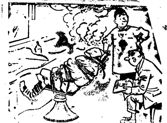
—Parece imposible todo lo que hay que hacer para que el cliente soporte las tarifas de transporte.