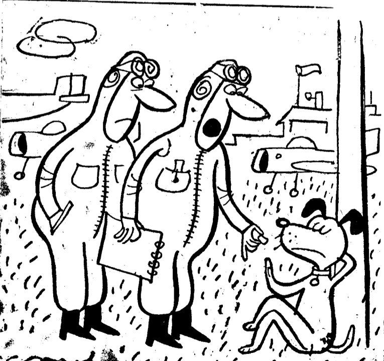
—Que tonto se ha puesto el perro mascota de la escuadrilla desde que se ha enterado que uno de su raza batió el record mundial de altura.