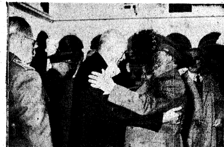
1. — El Jefe del Estado, Generalísimo Franco, besando a un niño acogido en el Colegio «María Cristina», durante la visita efectuada al mismo en Aranjuez.— 2. Bodas de Oro de la Promoción del Caudillo. — El Jefe del Estado recibe el abrazo de un compañero de promoción con motivo de su asistencia a los actos conmemorativos de las Bodas de Oro de la XIX promoción de Infantería, celebrados en Toledo.