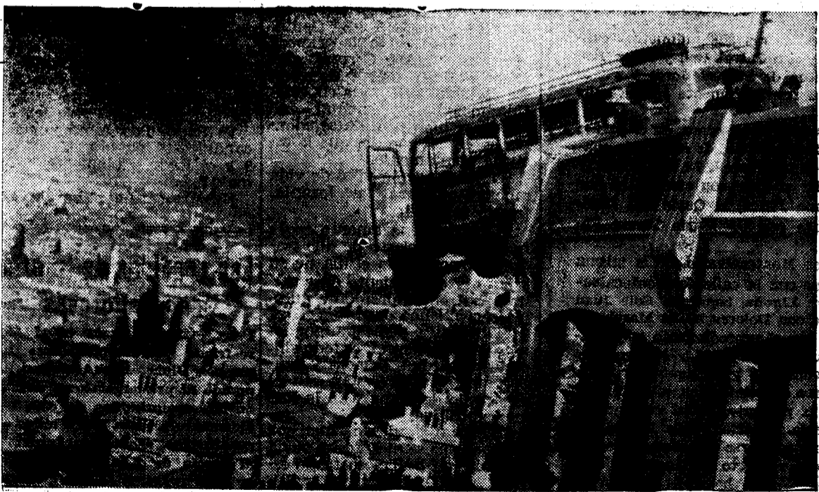
Después de una colisión entre dos autobuses, uno de los vehículos fue lanzado contra el pretil de un puente y quedó de esta forma, medio colgando sobre un precipicio de unos 80 metros. Una mujer, con un niño en brazos, presa del pánico, se lanzó desordenadamente al exterior del coche y pereció en el acto al caer en la sima. Los otros pasajeros fueron recogidos por el autobús causante del accidente, sin otro daño que un susto morrocotudo.