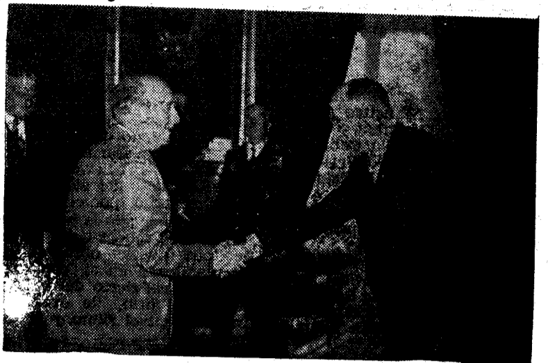
MADRID. — S. E. el Jefe del Estado saludando al señor Mahmoud Fawzi, ministro de Asuntos Exteriores de Egipto, en presencia de su colega español, señor Castiella, con motivo de la audiencia celebrada en el Palacio de El Pardo.