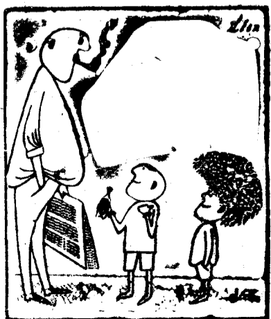
—Se tomó un trago de tu crecepelo.