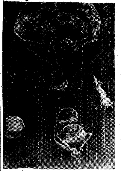
CLEVELAND (Ohio). — He aquí una impresión del llamado satélite «Meteor Junior» norteamericano, en dirección a la Luna, que avanzaría a una velocidad constante de 16.000 millas por hora y que llevaría una tripulación de tres hombres.