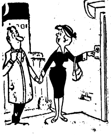
—No estés receloso. Papá siempre está contento cuando sabe que tengo novia.