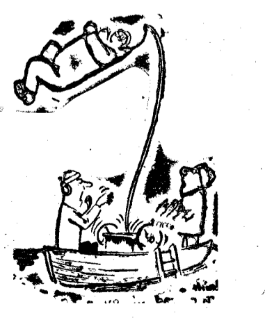
—¡Idiota! ¡Deja ya de bombear aire!