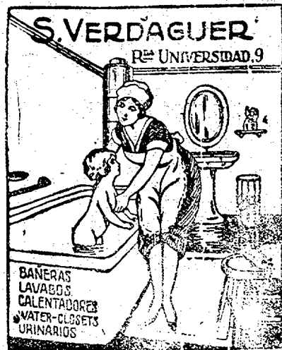
BARCELONA. — Tel. 10441

Talleres Mecánicos de CARPINTERIA, FUNERARIA Y EBANISTERIA de VENTURA, FIGUERAS Y BRUGUÉ DEPOSITO DE ATAQUES Gran surtido en coronas, pensamientos y lamparillas PRECIOS ECONÓMICOS Tienda Funeraria: Cort-Real 8 — Talleres: Portal Nou, 7 GERONA