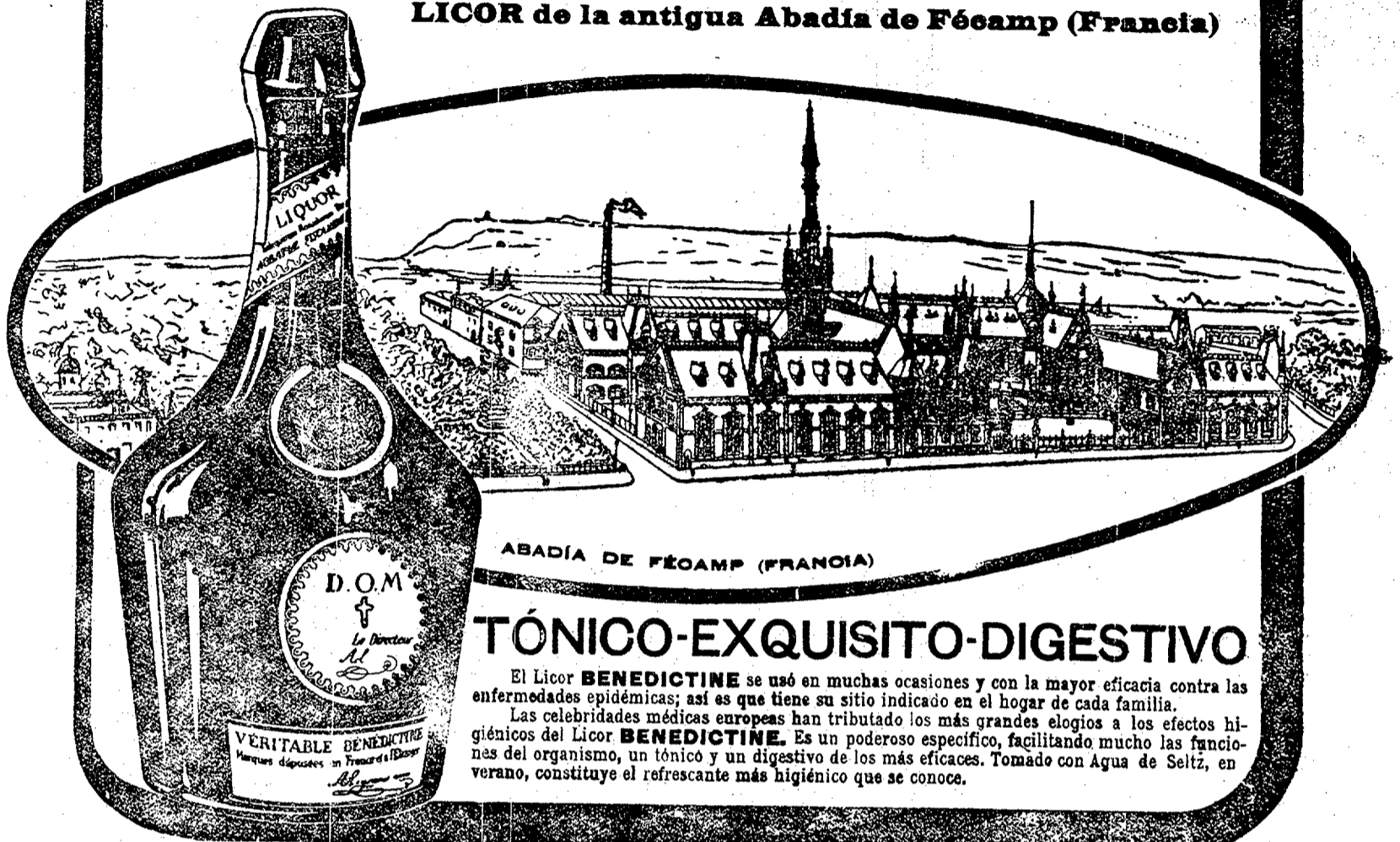
ABADIA DE FÉCAMP (FRANCIA)

LICOR de la antigua Abadía de Fécamp (Francia)