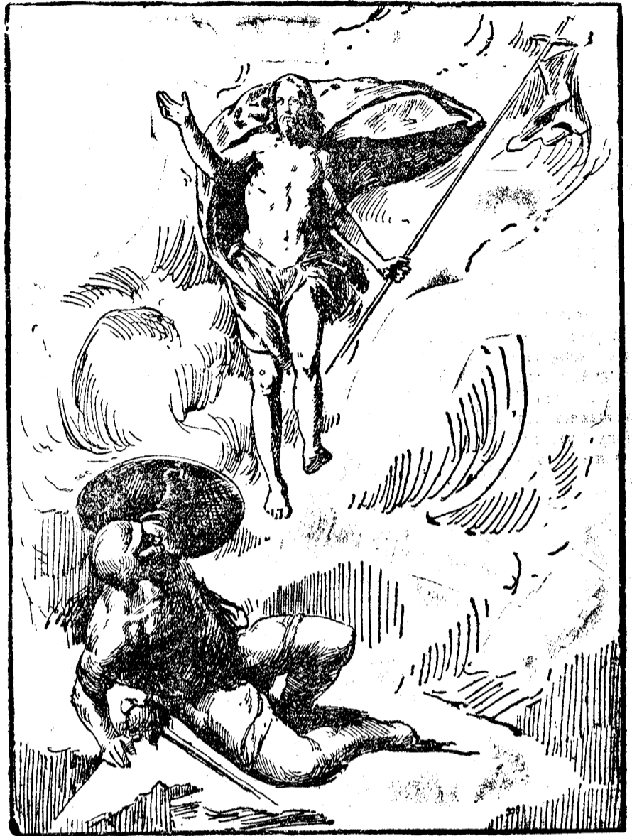
... "Resuscità el tercer dia d'entre els morts" ...

Especialista en enfermedades de la Garganta, Nariz y Oído. Ha trasladado su consultorio a la Carretera de Sant. Eugenia, número 1, 1.º, 1. Esquina a la Plaza del Marqués de Camps.