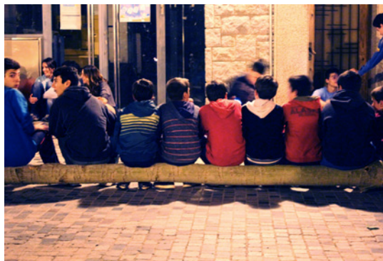
Moment de descans una vegada l'arbre ja està a la plaça.

Les persones grans són les encarregades de transmetre la festa als joves. Els més vells són els que tenen més experiència en la festa i els que tenen el coneixement de la tradició, el coneixement autèntic, tal com ells mateixos el denominen. I és autèntic perquè forma part del passat.