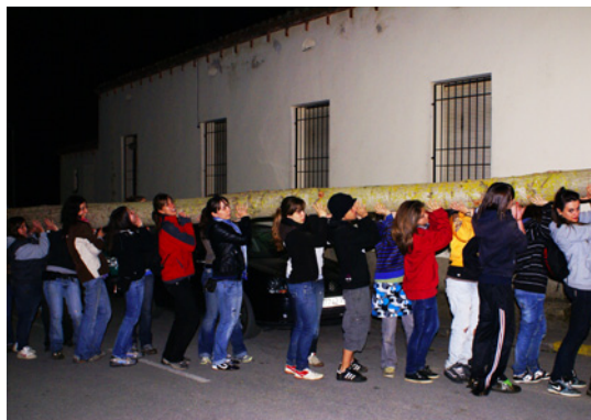
Arribada de l'arbre carregat a pes a la plaça.

Són les 2 de la matinada quan arriben amb l'arbre a la plaça. Els dirigents van mesurant la llargada de l'arbre apassant i apamant el diàmetre del tronc.