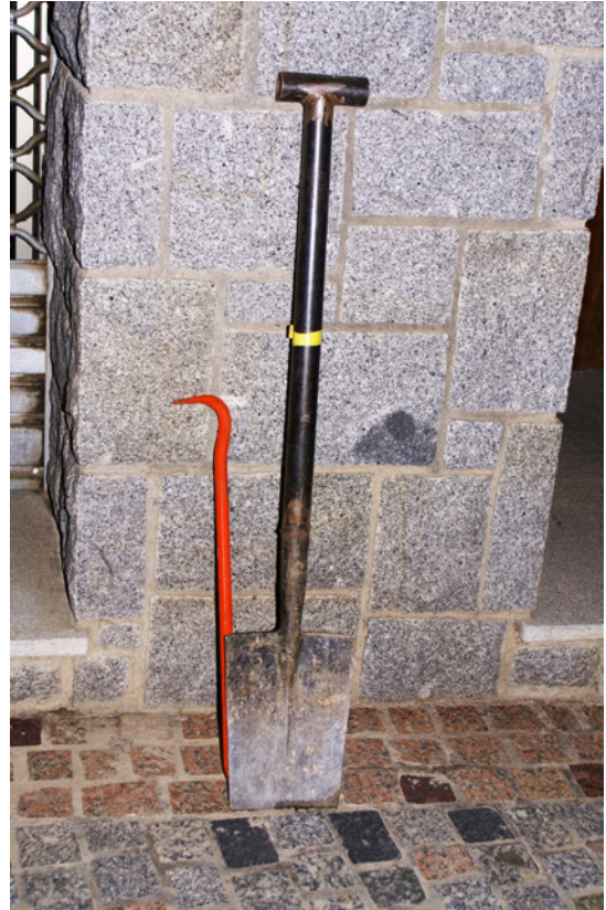
Algunes de les eines que s'utilitzen per plantar el poll.

botifarres. Van a buscar les escales i les cordes a l'Ajuntament, que és al costat, i un dels participants porta un parell de bastides.