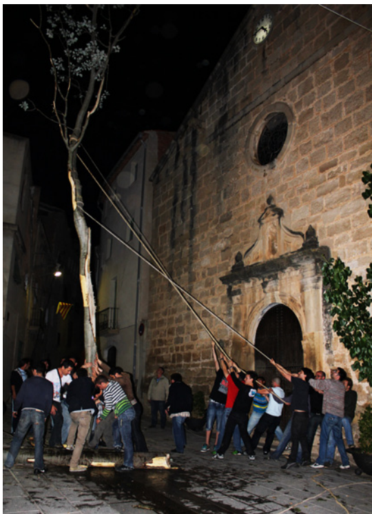
Els joves estiren les cordes per equilibrar l'aubí (Vinebre).

diu i fa la seva. L'arbre cau sobre un edifici del costat i ocasiona desperfectes –es trenquen els vidres d'una finestra i cauen uns fils elèctrics-. El tornen a aixecar i toca la façana de l'església i les agulles del rellotge. Tallen un tros d'arbre per facilitar-ne la plantada. Amb moltes maniobres aconseguen tornar-lo a aixecar, però tenen problemes per falcar-lo.