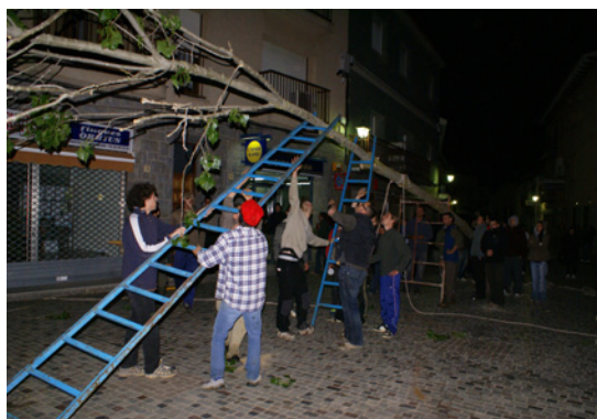
Per aixecar l'arbre es fan servir escales i bastides.