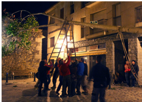
Els participants uneixen forces per plantar el Maig.

En resum, tot i que formalment el Maig a Òrrius es pot equiparar a altres festes en què es manifesta la identitat d'un poble, com és la Festa Major, a Òrrius el que la distingeix encara més és la força que expressa, la qual defineix la seva singularitat.