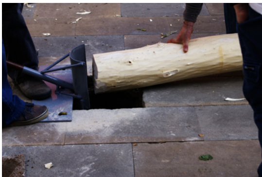
Eina que s'utilitza a Folgueroles per introduir l'arbre al forat.

Tallen la punta del tronc pels costats, per tal de poder-lo encaixar amb l'eina quan comencin a alçar-lo. Lliguen tres cordes a dalt del tronc,