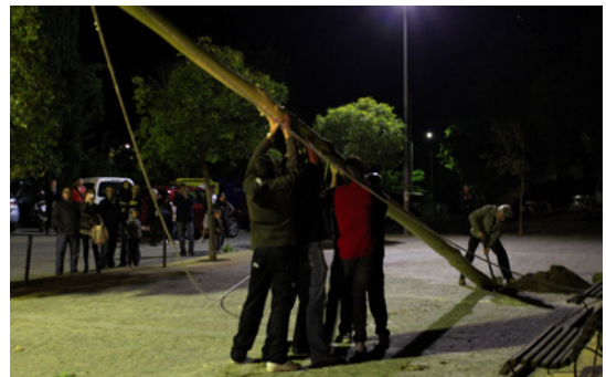
Encaixada de l'arbre al forat amb l'aixecador al fons (Canyamars).