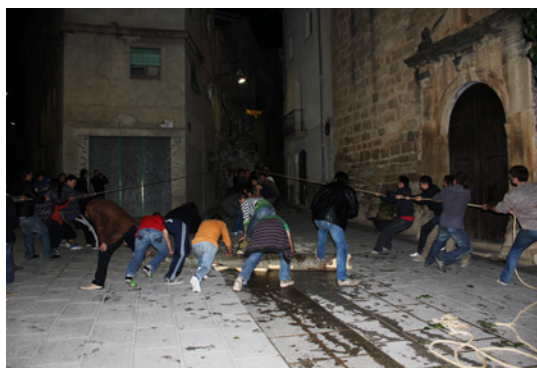
Els joves col·loquen un tros de tronc horitzontal per fer de topall mentre els altres estiren de les cordes (Vinebre).

Quan arriben al poble descarreguen l'arbre i l'estiren amb cordes fins a la plaça, passant per carrerons estrets i maniobrant el tronc per passar entre cantonades i cotxes aparcats. Mouen dos cotxes a pes i tallen un tros del tronc per poder fer-lo passar entre els carrers. Així i tot,