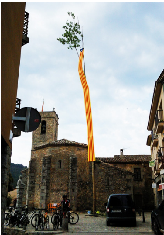
El Maig roman a la plaça durant unes setmanes.