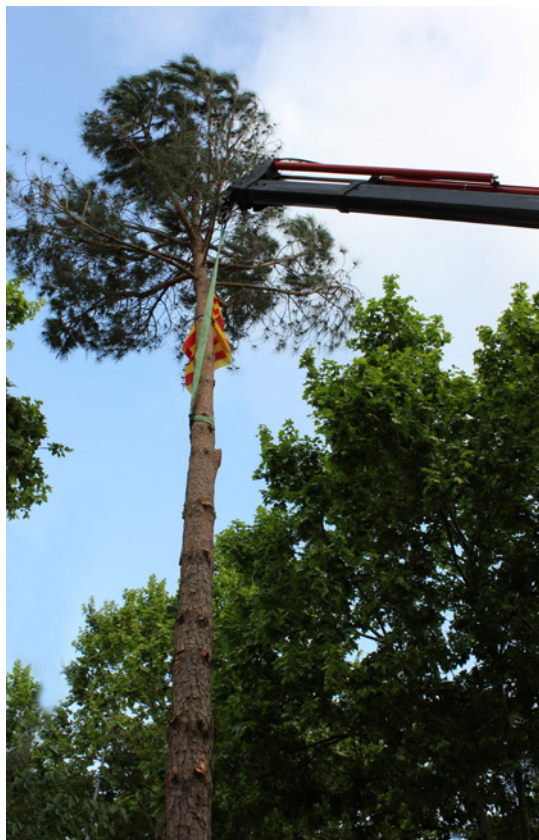
Plantada del pi amb grua (Castell d'Aro).

«No poden dir res, perquè és una festa tradicional!»