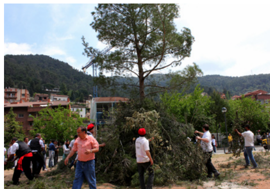
Els participants col·loquen branques al voltant del pi una vegada plantat (Figaró-Montmany).

Ens expliquen que fa cinquanta anys la festa es feia a la plaça Major, però que es va canviar d'ubicació perquè era incòmode i l'arbre havia de