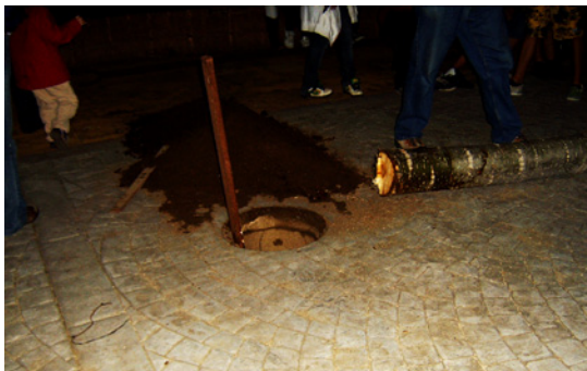
El tronc del pollancre enfocat al forat que ja està destapat (Canyamars).

El dirigent de més edat va donant algunes instruccions per disposar les cordes: passen dues cordes per dalt del tronc de l'arbre, fan dues voltes i enrotllen els dos caps, que surten de cada corda, entre ells. En total els queden quatre caps que són els vents; al final de cadascun es formen grups de 4 o 5 persones que estiren. Col·loquen dues eines de ferro, una més llarga i l'altra més curta, que semblen forques de dues pues, en forma de u. El dirigent més experimentat va donant les instruccions: