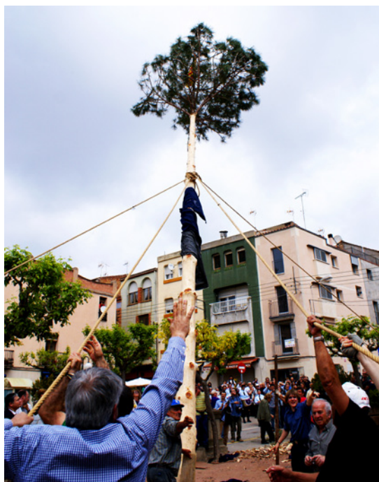
L'arbre en el moment de l'aixecada amb l'ajuda de les cordes (Sant Llorenç Savall).

de participants es troben a la plaça de l'Església per anar cap al bosc a buscar l'arbre: un pi que més tard es plantarà a la mateixa plaça. La plaça està empedrada i al mig han aixecat algunes rajoles per fer-hi el forat on plantaran el pi. El forat és rectangular, d'un metre de fondària aproximadament, i està barrat pels quatre costats amb tanques de l'Ajuntament.