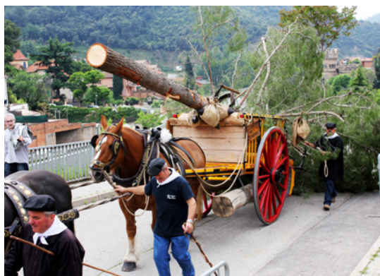
Transport del pi amb carro a l'entrada del poble (Figaró-Montmany).

Cap a les 12 del migdia, davant de l'estació de tren, es van trobant els trabucaires i altres persones que esperen l'arribada del pi. El pi apareix estirat sobre un carruatge arrossegat per cavalls i burros ben guarnits per a l'ocasió. Travessen el pont i passen dues vegades pel carrer principal