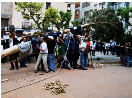
Els participants aixecant l'arbre a pes (Sant Llorenç Savall).

una banda, fet que ajuda a encaixar bé l'arbre i a aixecar-lo aguantant el tronc a pes i cobrint-lo amb draps de roba per protegir-se de la resina. Els bombers i alguns homes acosten una mica més el pi al forat arrossegant-lo per terra.