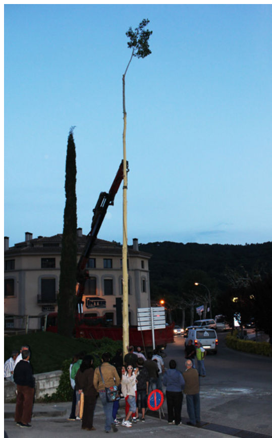
La grua encaixant l'arbre al forat (Dosrius).