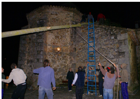
La teulada de l'església serveix per recolzar l'arbre i facilitar la maniobra.

Ara manen els de la teulada: quan ells donen l'ordre, els altres han d'empènyer l'arbre en direcció a la teulada i col·locar la copa. Mouen la primera escala més avall i van repetint aquesta seqüència fins a tenir tot l'arbre recolzat a la primera teulada de l'església. Després aixequen la copa i la recolzen a la segona teulada de l'església, gairebé en paral·lel i tocant al forat.