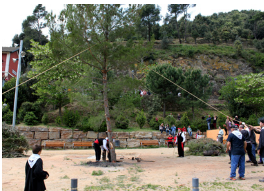
Els participants estiren de les cordes per plantar el pi (Figaró-Montmany).

l'Associació d'Amics dels Sants Patrons i la Festa del Pi. La festa la finança l'Ajuntament i forma part d'un programa d'actes més extens que dura tres dies on hi col·laboren moltes entitats i comerços del poble.