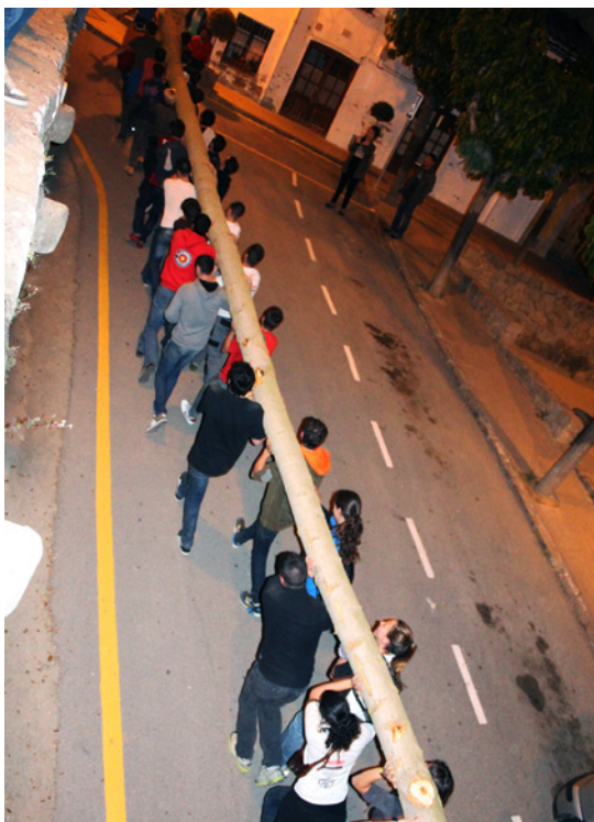
Els joves transporten a pes el poll fins a la plaça.

El dia de la Plantada del Maig és llarg. Des que es va a escollir l'arbre fins que es deixen les penyores o objectes al voltant de l'arbre poden passar dotze hores. No obstant això, nosaltres distingim diferents fases.