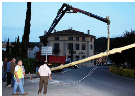
La grua aixecant el tronc de l'arbre (Dosrius).