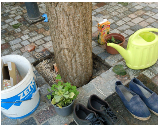
Alguns dels objectes agafats de les cases al voltant del Maig.