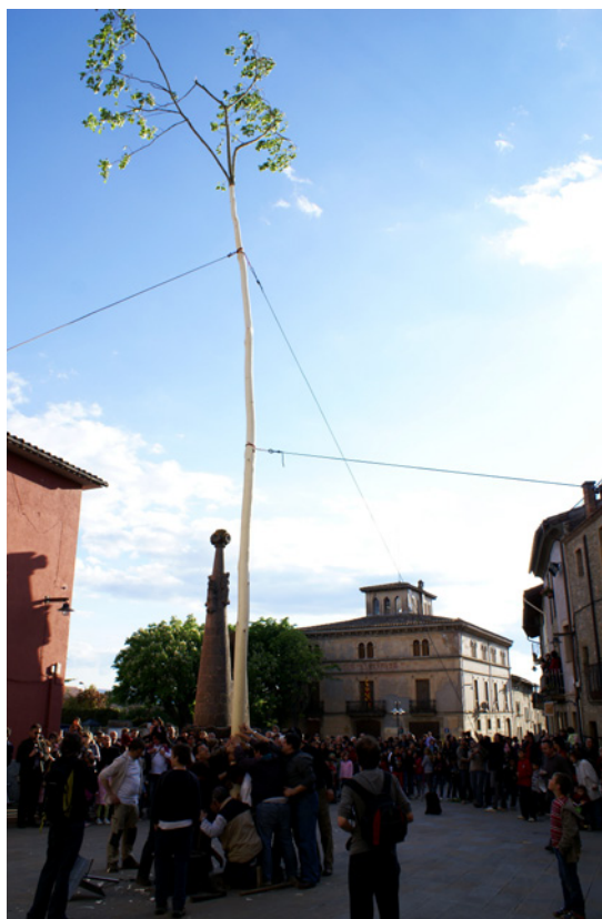
L'arbre a mitja tarda plantat a la plaça Verdaguer de Folgueroles.

en comitiva a buscar l'arbre al bosc amb el so de tres flabiolaires contractats per a l'ocasió. Un cop al bosc, situat al Parc Natural de les Guillerries-Savassona, es talla l'arbre. La gent es va afegint a la festa fins a arribar al centenar de persones. La majoria són famílies del poble. Entre la gentada, hi ha els que organitzen la jornada. Un d'ells va comentant i dirigint la trobada amb el megàfon: anuncia l'arribada del llenyataire que tallarà l'arbre i, amb un to molt pedagògic, explica que allà on es tallarà fa uns dies hi van plantar uns arbres petits, que amb el temps es faran grans com el que tallaran avui. L'arbre es reconeix per-