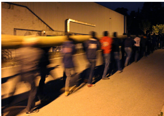
Imatge del transport del poll del bosc a la plaça.

A través de les entrevistes fetes a les generacions més grans, hem pogut constatar quins elements de la festa han canviat i quins s'han mantingut. Això ens ha permès fer-nos una idea de la transformació d'alguns aspectes de la festa, en alguns casos inevitable a causa dels canvis socials, econòmics i polítics que hi ha hagut al llarg del temps. Però també de la pervivència del ritual, que s'ha mantingut amb pocs canvis formals. Començarem a veure, doncs, quin paper hi juga la tradició i constatarem que el ritual retrata una estructura social determinada en un moment o altre.