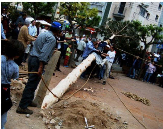
El tronc de l'arbre enfocant al forat. Uns participants aixequen el tronc mentre que un altre aguanta la fusta que fa de calçador (Sant Llorenç Savall).