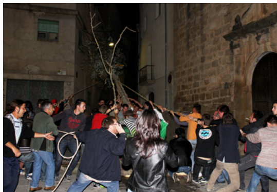
Moment de l'aixecada de l'aubi a la nit (Vinebre).

A Vinebre (Ribera d'Ebre), els cartells penjats pel poble anuncien el programa d'actes de la