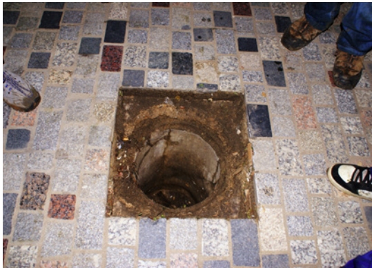
El forat fet expressament a la plaça empedrada on es planta cada any l'arbre.

A un quart de dotze de la nit, la plaça de la Constitució està plena de gent jove –unes quaranta persones que van arribant-. En Pau ve carregat amb pales i un carretó que els ha de servir per posar sorra allà on faran les botifarres. Els participants van arribant a la plaça, molts d'ells amb barretina. Destapen i netegen el forat on s'hi ha d'encaixar l'arbre. Treuen les pilones que els poden molestar de la plaça i porten branques i troncs per començar a fer la brasa per a les