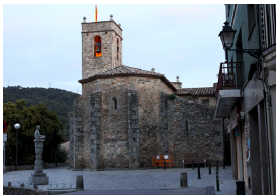
La plaça de la Constitució d'Òrrius amb l'església al fons.

Pel que fa a l'activitat cultural de la vila, a banda de la Festa del Maig, cal destacar el Pessebre Vivent, que reuneix molts visitants durant