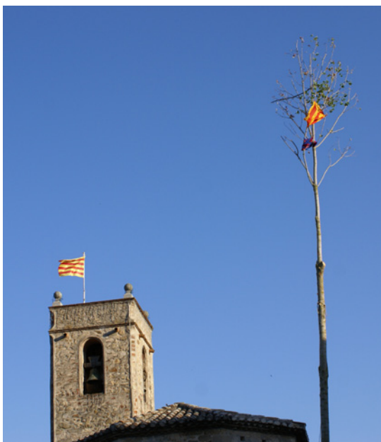
Imatge del Maig plantat amb el campanar d'Òrrius al fons.

no és vigent. Fàbregas (1979) expressa aquesta dessacralització d'alguns cultes en què la forma ha mantingut una estructura molt igual o semblant. En general, doncs, per alguns autors, molts rituals s'han dessacralitzat; però no per això han perdut el caràcter de "ritual". Quan ens referim a 'ritual' delimitem conceptualment aquest terme, ens allunyem de l'ús i dels significats clàssics relacionats amb el camp religiós i l'ampliem a l'estudi dels ritus seculars (Ariño, 1998:10).