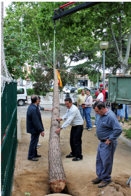
La grua col·loca el pi al forat on quedarà plantat (Castell d'Aro).

gada i florida i ens diuen que el motiu o l'origen és la fertilitat de les terres i que es fa en honor a sant Isidre, patró dels agricultors. Treuen l'arbre del carro amb la grua, l'aixequen en posició vertical, l'orienten cap al forat, el col·loquen a dins i tapen el voltant del tronc amb terra. Quan ja està plantat, un home treu la corretja del tronc utilitzant una tanca com a escala.