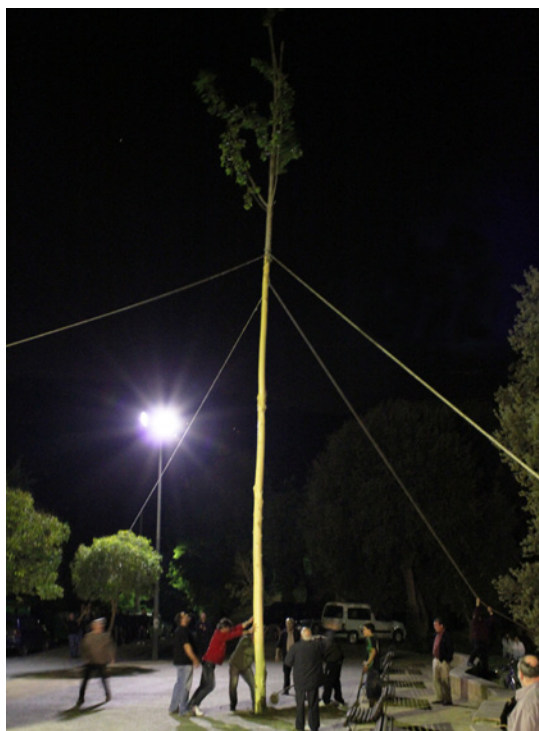
L'arbre a punt de ser plantat a Canyamars.

Cap a les 8 del vespre del dia de la celebració, ja hi ha alguns dels organitzadors a la plaça de l'Església. També hi ha un grupet de persones que prepara el foc per fer les sardines. La plaça està empedrada i hi ha un forat que l'Ajuntament ha fet especialment per plantar el Maig que durant l'any tapen amb sorra. Alguns dels participants es quei-