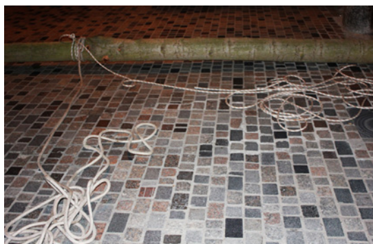
Detall de les cordes lligades al tronc del poll per a la plantada.