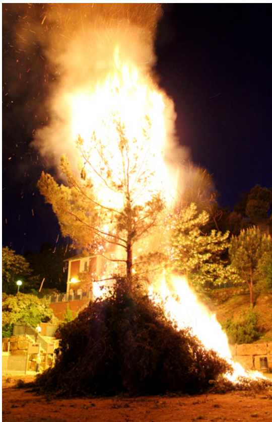
A la nit es crema el pi (Figaró Montmany).

ser més petit per qüestions d'espai, és a dir, l'espai els obligava a reduir la mida de l'arbre. Després, però, van anar al costat del camp de futbol i com que hi havia més lloc, l'arbre podia ser més gran i el van haver de començar a portar amb camió. Actualment, però, és més petit perquè el porten amb carro i la normativa els limita molt.