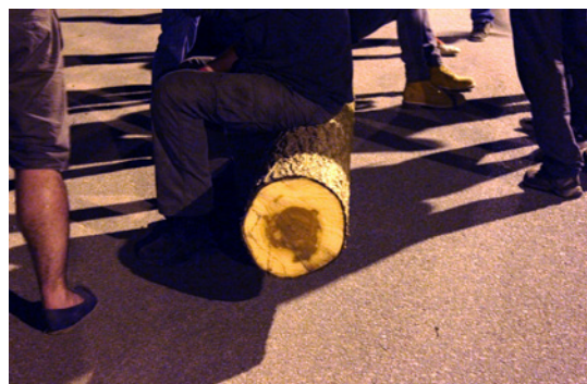
Un participant descansant sobre el tronc tallat durant el transport de l'arbre a la nit.

a Espanya i en l'àmbit europeu. Entre els estudiosos que han investigat aquesta festa de manera més exhaustiva, trobem explicacions que situen l'origen de les festes del Maig en l'època de l'Imperi Romà i relacionen aquestes celebracions amb les festes en honor a la deessa Maia. Lluny d'aquesta hipòtesi, Caro Baroja (1979) afirma que hi ha escrits del segle XVI que mostren que les festes del Maig eren molt conegudes arreu. Ara bé, l'explicació genèrica que més abunda a la bibliografia sobre el Maig és que l'origen es troba en les festes agrícoles relacionades amb la primavera. Aquestes festes poden tenir un caràcter dendrològic, és a dir, tota la celebració gira al voltant d'un arbre o d'una forma vegetal, com és el cas del Maig d'Òrrius, però també pot girar entorn d'una forma humana, com és el cas de les festes del Mayo o la Maya , que s'han celebrat principalment a Espanya. També s'han documentat variants mixtes que combinen formes vegetals amb humanes. Leopold von Shroeder (a Caro Baroja, 1979) considera que l'origen del Maig podia ser indogermànic per la similitud d'aquesta festa amb el ritual que festejava el sol i l'aigua, en aquella zona. Combinant aquestes interpretacions, Amades (1952) sosté que a través d'aquests ritus es buscava purificar i assegurar bones collites, i considera que les