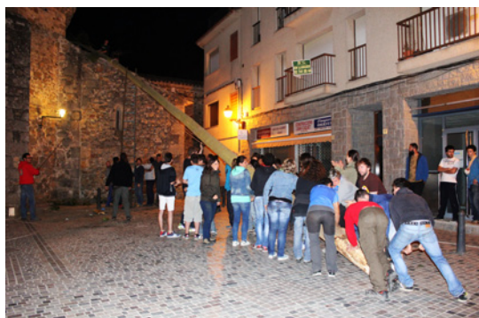
L'arbre recolzat a la primera teulada de l'església.

Els participants continuen aplaudint i cridant cada vegada que aconseguen fer un moviment. Llavors els dirigents donen l'ordre d'agafar les cordes que fan de vents. Es formen tres grups de joves que estiren les cordes. En