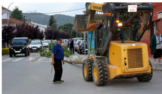
L'arbre és transportat amb una excavadora del bosc a la plaça (Dosrius).

Una vegada pelat, només deixen una branca que és la principal –l'ull queda molt reduït–. Seguida-