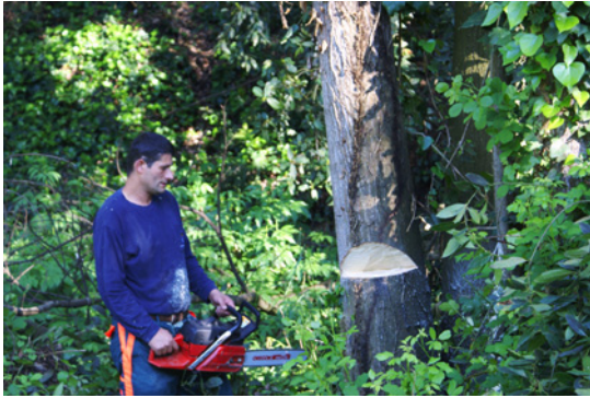
L'arbre es talla amb motoserra la mateixa tarda de la plantada.