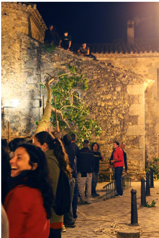
Els participants tenen diferents funcions durant la plantada.

malitzada, sí que es poden distingir unes normes implícites i un funcionament més o menys consensuat, o si més no, acceptat i respectat. És a través de la mateixa estructura ritual que s'estableix un ordre determinat, tant en la construcció externa (forma, actes), com en la interna (organització dels participants). D'aquesta manera, hi ha una estructura i es creen unes dinàmiques pròpies, a través de les quals es desenvolupa la festa de forma més o menys ordenada. Davant de la percepció de desordre, doncs, el ritual porta implícita una organització i una jerarquia interna que generen una sensació d'ordre als par-