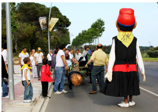
Transport de l'arbre amb carro fent cercavila amb la colla de geganters (Castell d'Aro).