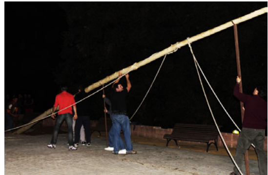
Aixecada de l'arbre amb les eines: les cordes, les «forques» i la cullera (Canyamars).

Llavors, es plaça el tronc al forat amb més precisió, amb l'ajuda d'una altra eina –que hem anomenat cullera o aixecador perquè, bàsicament, ajuda a instal·lar l'arbre en el forat fent de topall-. Un dels participants agafa la forca més llarga, que col·loca ben a prop de la copa i el segueix un altre participant que agafa l'altra forca més petita i la situa cap a la meitat del tronc.