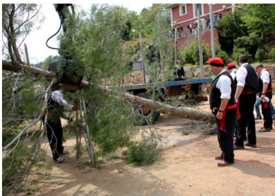
Amb la grua i l'eina se subjecta el pi per plantar-lo (Figaró Montmany).