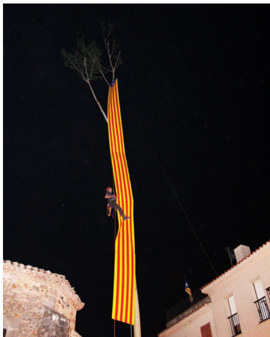
És tradició posar una bandera catalana o del Barça penjant de l'arbre. L'any 2014 s'hi va penjar una estelada de grans dimensions.

Veiem doncs que, com en tota festa, el Maig no està exempt de tensions. Hi trobem persones incloses i persones excloses. Aquesta exclusió, però, pot ser deguda tant a actituds personals com a opcions, decisions o afeccions del propi grup.