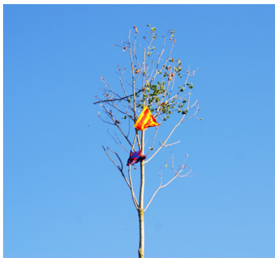
La copa de l'arbre plantat a la plaça amb les banderes uns dies després de la plantada del Maig (Òrrius).

Durant el dia de la Plantada es poden distingir diferents fases o moments de la festa: a) la tarda, en què s'escull i es talla l'arbre: un poll o pollancre 4 d'algun bosc proper al poble; b) els volts de la mitja nit, moment en què els joves es troben a