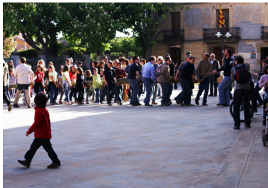
Els participants carreguen l'arbre amb uns bastons, seguint la seva tècnica (Folgueroles).

què hi han pintat dues cares amb esprai de color rosa. Lliguen una corda al tronc de l'arbre, sota la copa. Seguidament, arriba un home gran, conegut al poble, amb una destral, i tothom aplaudeix. Demanen a la gent que es col·loqui en un costat per mirar com l'home talla l'arbre: uns quants cops de destral i tomba l'arbre amb l'ajuda de la corda que uns altres homes estiren en direcció a la caiguda. Quan cau, la gent aplaudeix. L'arbre no és gaire alt, deu mesurar uns 15 metres. L'home agafa una destral més petita i talla els troncs i nusos que sobresurten. Es queden uns quants homes que lliguen una corda a l'extrem del tronc (a la part de l'ull), per arrossegar l'arbre fins al camí; uns altres homes aguanten la copa, que no toca a terra. Una vegada al camí, en direcció al poble, reparteixen uns bastons, que mesuren uns dos pams, per cada dos nens. Tots els nens estan distribuïts al llarg de l'arbre, un a cada costat, i amb els pals aguanten l'arbre per sota, per transportar-lo. Uns homes es col·loquen al davant per aguantar l'arbre, també amb els pals, i uns altres al darrere per aguantar la copa. Van caminant i parant i deixant l'arbre a terra sobre uns troncs més gruixuts. D'aquesta manera, l'arbre no toca a terra, la copa no es trenca i després poden tornar