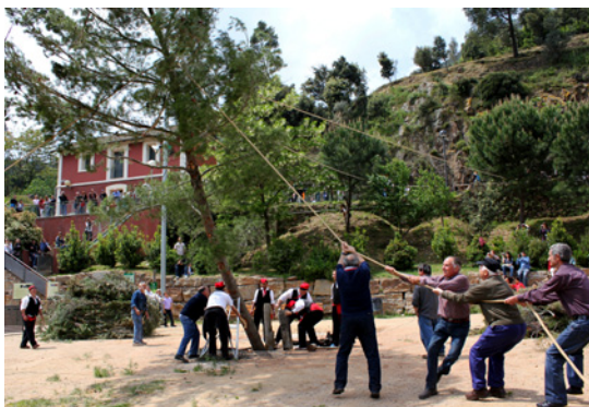
Diversos homes estirant les cordes per encaixar el tronc al forat.

estructura triangular de ferro, acabada amb una forma semiesfèrica amb la qual aguanten el tronc de l'arbre.