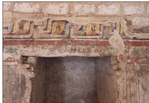
Figura 14. Sector 24. Detall de pintures de la cripta.