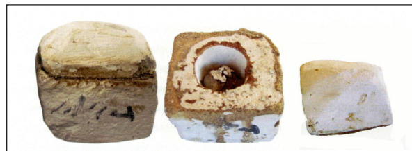
Figura 23. Osireion. Caixetes i boles màgiques. Ritual de les quatre boles relacionat amb els Misteris d'Osiris del mes de Khoiak.