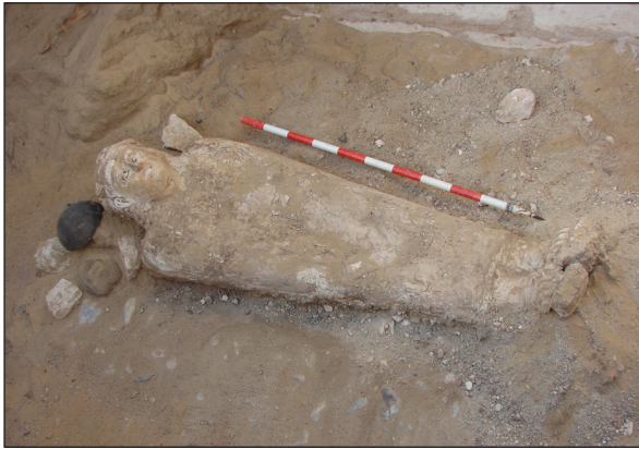
Figura 8. Tomba 31. Mòmia amb cartonatge.

La missió arqueològica d'Oxirrinc també ha estudiat l'arquitectura i les decoracions de les tombes d'aquest període que ja s'havien descobert abans de la nostra arribada. Com per