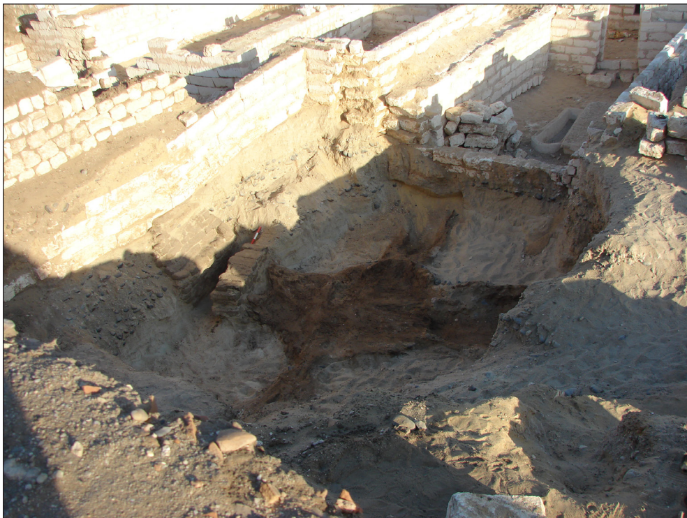
Figura 17. Àmbit 32. Vista aèria del sector dels peixos de la campanya del 2012.

Al perfil sud d'aquest àmbit es va localitzar un pou (profunditat de 4 m, diàmetre exterior d'1,20 m i diàmetre interior de 0,90 m) construït totalment amb blocs de pedra. Es va poder constatar que a l'interior s'hi havien fet les puntes, metre a metre de profunditat, per facilitar-hi l'accés. A 4 metres de profunditat es va haver d'abandonar l'excavació del pou perquè va aflorar l'aigua del nivell freàtic, tot i que la construcció continuava i no en sabem la profunditat total (figures 17 i 18).