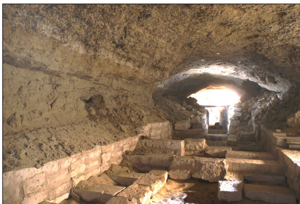
Figura 21. Osireion. Vista de la segona fase de construcció de la galeria 1A (E-W).