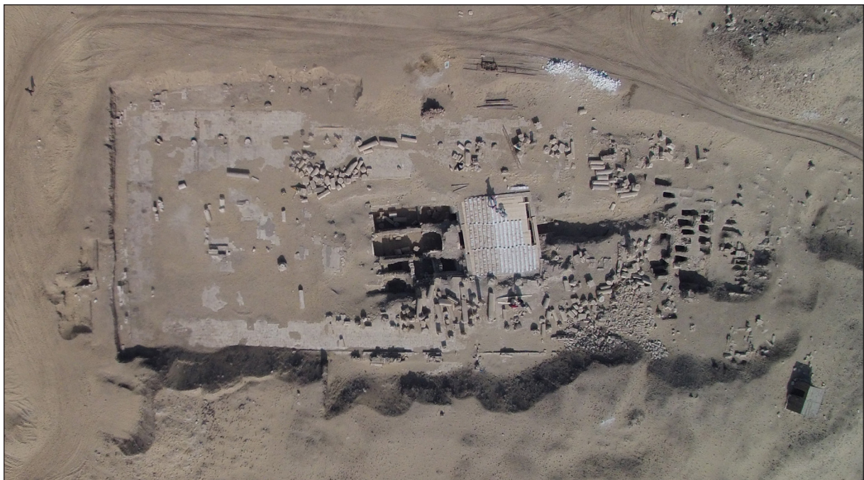
Figura 10. Sector 24. Vista aèria.

En origen, sembla que aquesta estructura podria haver estat un temple d'època hel·lenística, un serapeu. Aquesta hipòtesis ve donada pels papirs i per les troballes arqueològiques (fust amb el cartutx de Filip Arrideu 26 (figura 11). Durant l'Alt Imperi es va construir una via porticada en direcció est-oest, molt ben pavimentada i amb quatre fileres de columnes (2 al nord i 2 al sud). Possiblement es tracta-