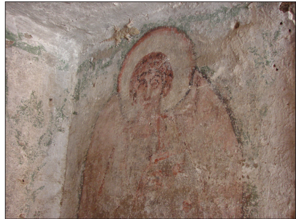
Figura 13. Sector 24. Detall de pintures de la cripta.