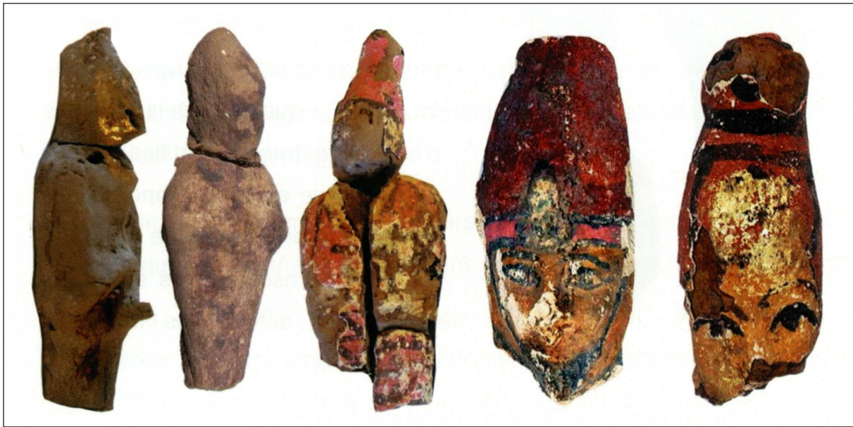
Figura 24. Osireion. Figuretes d'Osiris relacionades amb els Misteris d'Osiris del mes de Khoiak.

obertura a la visita. A més, durant l'any 2018 va sortir a la llum la publicació d'aquest temple-necròpolis osiriàc, on se celebraven els Misteris d'Osiris durant el mes de Khoiak .