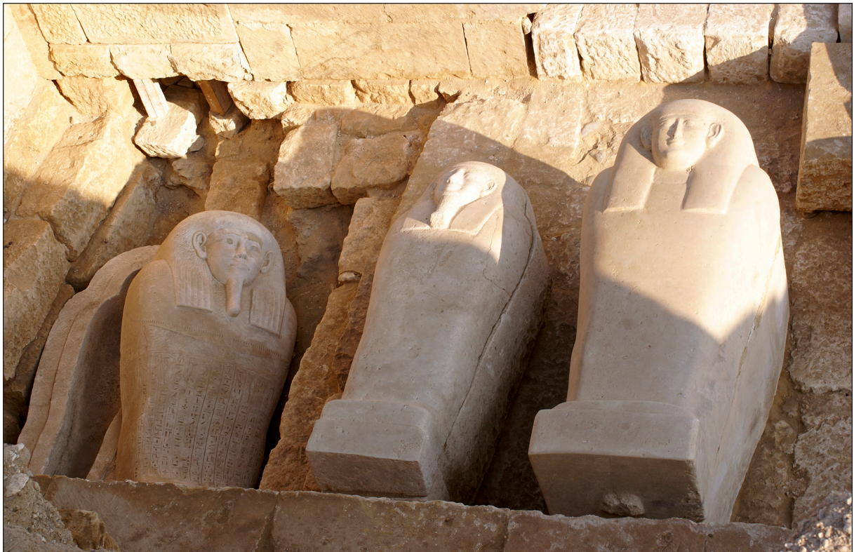
Figura 5. Tomba saïta 14. Detall de tres dels sarcòfags localitzats.