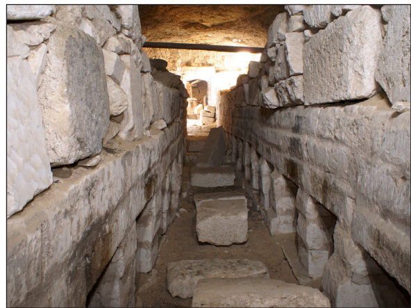
Figura 22. Osireion. Vista de la primera fase de construcció de la galeria 1A (W-E).