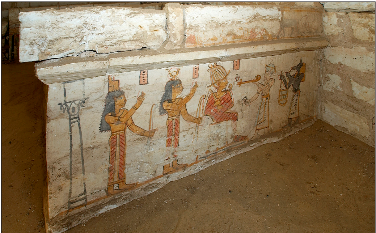
Figura 9. Tomba 3. Detall de pintures.

Del període paleobizantí corresponen les grans construccions fetes amb tovot que ocupen els estrats superiors de les zones encara no excavades de la Necròpolis Alta. La missió catalana, després d'avaluar la situació, va endegar