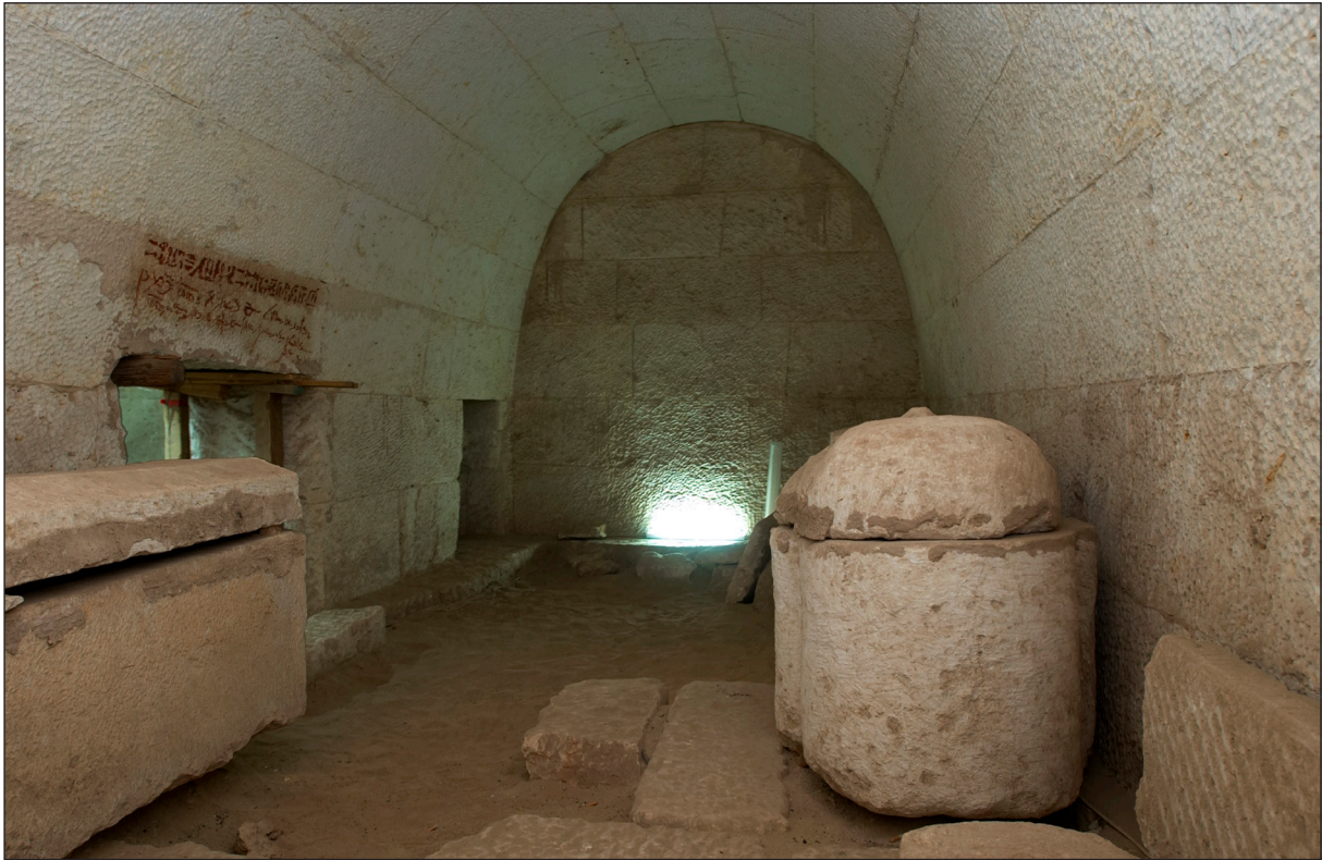
Figura 2. Tomba saïta núm. 1. Interior de la cambra 2.