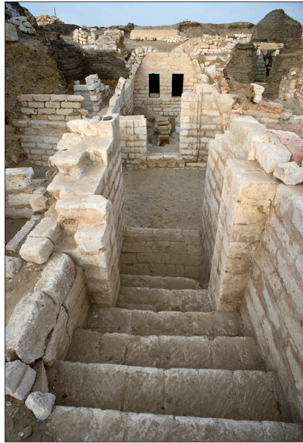
Figura 6. Tomba 11.

En aquesta àrea es concentren nombroses tombes de pedra d'època grecoromana. La primera tomba trobada per la missió va ser la número 11 durant la campanya de l'any 1992, tot i que la presència de la casa funerària paleobizantina i la necessitat d'estudiar-la va impedir prosseguir aleshores l'excavació d'aquesta tomba. Alguns anys més tard es van poder reiniciar els treballs arqueològics en aquest indret 12 (figura 6). Al costat d'aquesta s'han localitzat les estructures d'altres tombes de