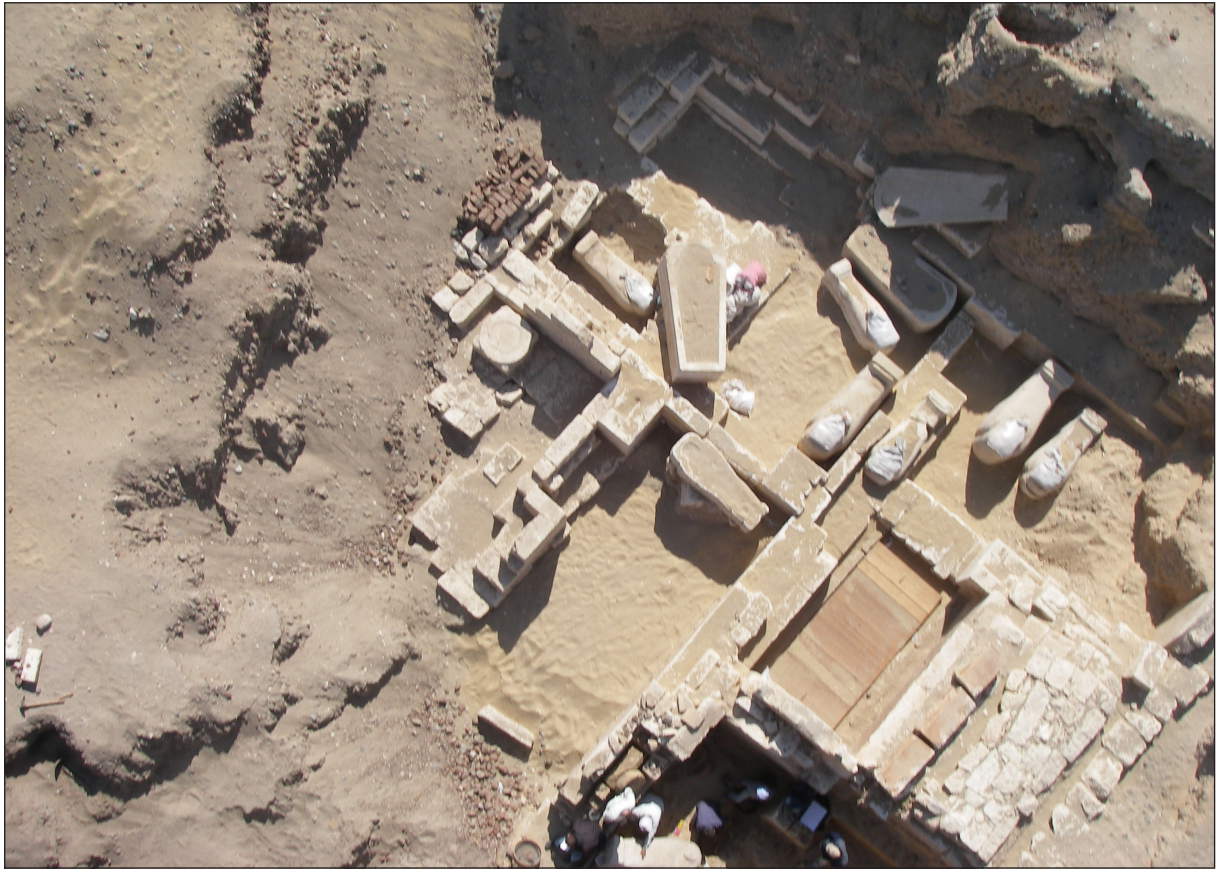
Figura 4. Vista aèria de la tomba saïta 14 durant els treballs d'excavació.