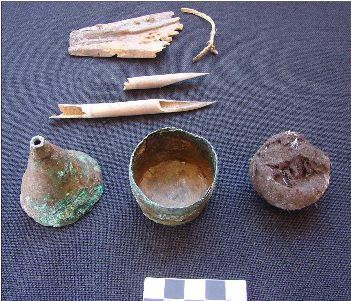
Figura 25. Conjunt d'estris d'escriba localitzats a l'interior d'una tomba paleocristiana.