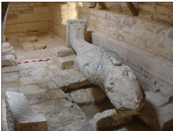
Figura 20. Osireion. Sala de l'Osiris.

Segueixen vigents els treballs de consolidació i restauració de l'Osireion per a la seva