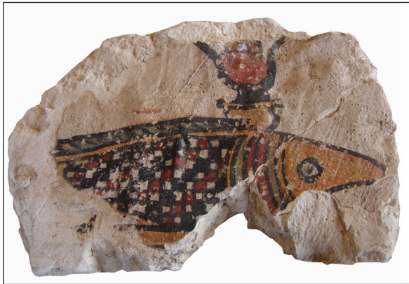
Figura 15. Sector 26. Tomba 18. Detall de pintura del peix oxirrinc.