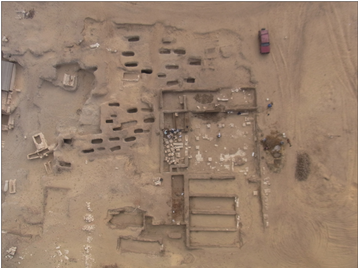
Figura 16. Sectors 29 i 30. Vista aèria.

minat àmbit 32, 35 que contenia una enorme quantitat de peixos de mides molt diverses i disposats per capes. La zona dels peixos que estava en contacte amb els murs de la capella s'adossava i s'hi remuntava. Aquest fet ens confirma que l'estrat de peixos és posterior a la construcció de la capella.