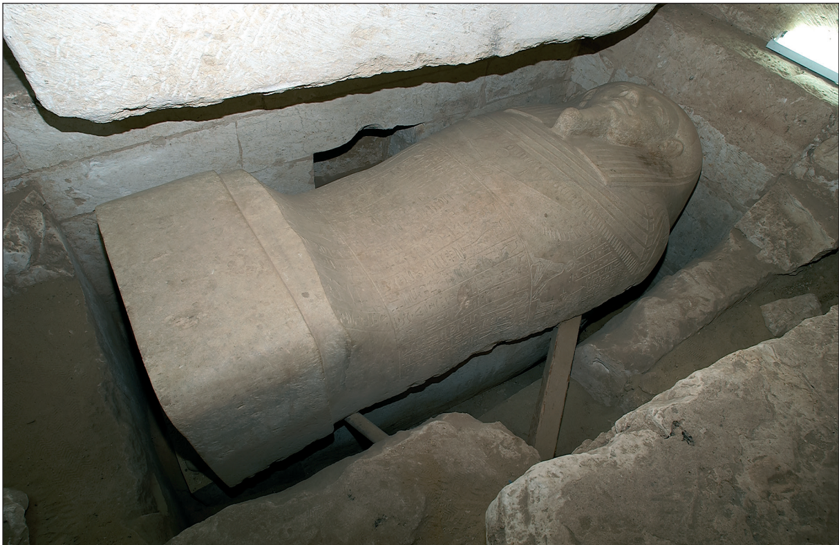
Figura 3. Tomba saïta núm. 1. Sarcòfag del sacerdot Het. Cambra 3.