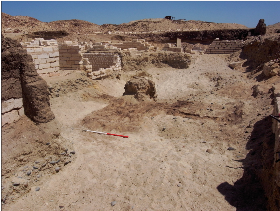
Figura 18. Àmbit 32. Vista aèria del sector dels peixos de la campanya del 2013.

Des de la dinastia XIX es pot testimoniar el culte a la deessa Tueris al XIX nomus de l'Alt Egipte. A Oxirrinc, segons indica el Papir Wilbour, 36 el seu culte es reafirma clarament durant l'època grecoromana com una de les divinitats més venerades de la ciutat. Existien diversos temples dedicats a la deessa Tueris, el més important és el Thoereion/Thoerion , situat al centre de la ciutat. 37 Tot i la rellevància d'aquesta divinitat no s'ha localitzat cap vestigi ni cap temple dedicat a Tueris d'època faraònica, però gràcies a les inscripcions de les tombes 1 i 14 de la Necròpolis Alta es pot