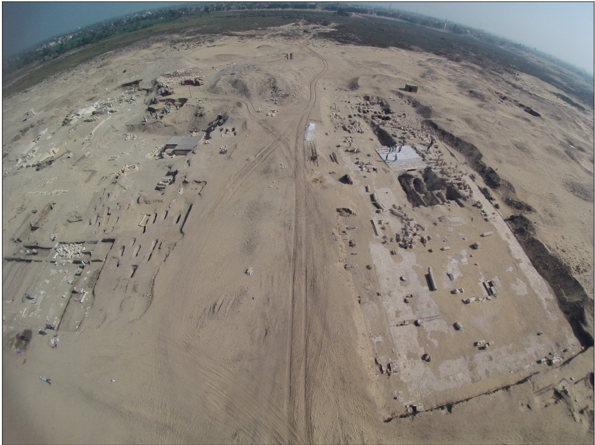
Figura 1. Vista aèria de la zona de la Necròpolis Alta.