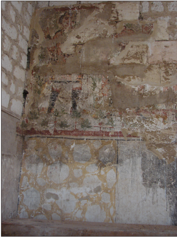
Figura 12. Sector 24. Detall de pintures de la cripta.