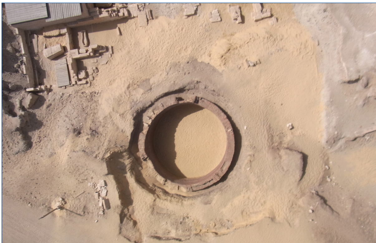
Figura 19. Sector 33. Vista aèria de l'estructura circular.

En el cas d'Oxirrinc és possible que també tingués un doble brocal (avui només en té a l'interior), una escala d'accés (encara sense descobrir) i un pou d'aigua al centre, que va haver d'estar a una profunditat superior a 5,17 m, però que avui està cobert pel nivell freàtic.