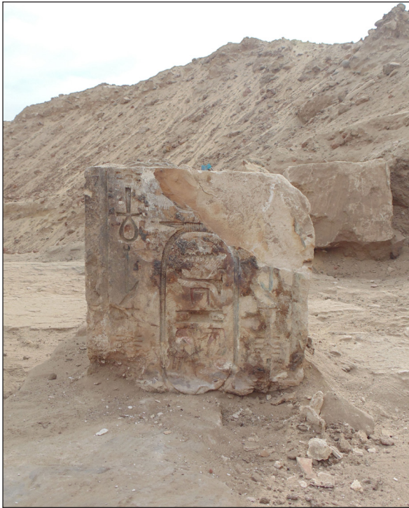
Figura 11. Sector 24. Detall del fust amb el cartutx de Filip Arrideu.

ria del carrer ample del nord que esmenten els papirs i hauria estat la via processional que arribava fins a l'Osireion. 27