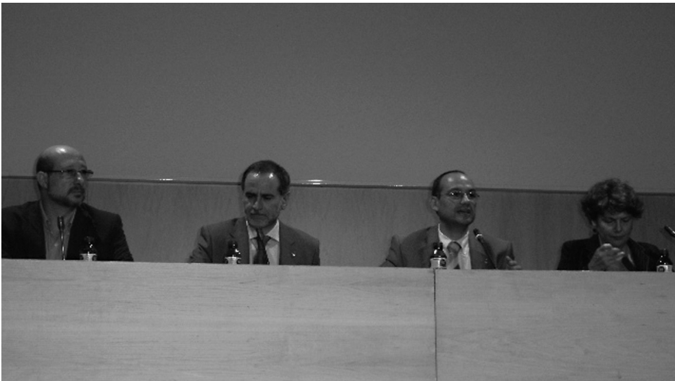
Inauguració de l'exposició a la Biblioteca Can Fabra de Gràcia.

Facultat de Geografia i Història. Universitat de Barcelona