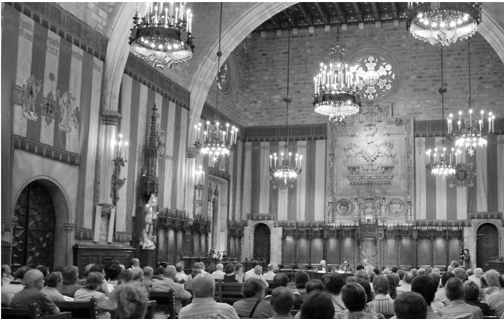
Acte inaugural del projecte de commemoració del centenari de la Setmana Tràgica dels Grups de Recerca Local de Barcelona al Saló de Cent de l'Ajuntament de Barcelona. Fons IRM.

Si les commemoracions tenen alguna mena de sentit és per a fer-nos entendre d'on venim i per saber on volem anar. El projecte «La Setmana Tràgica als barris de Barcelona: motius i fets» ens ha servit si més no per saber que els temps pretèrits ni han estat fàcils, ni idíl·lics i segurament per saber també cap on no volem anar. Cap on hem d'anar, ens cal decidir-ho entre tots i una bona manera de contribuir-hi és fer-ho des del coneixement del passat i del compromís cívic vers el futur.