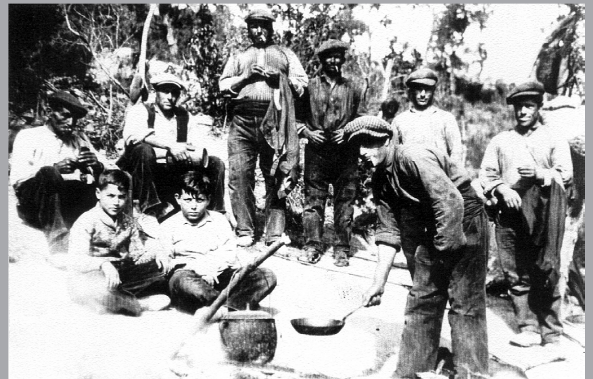
Eines per a treballs de memòria oral

"Grup de carboners de la colla d'en Magí Ferrer als boscos de Santa Coloma de Farners, preparant el dinar". Bosc de l'Agustí, Santa Coloma de Farners (La Selva), 1934-1935.