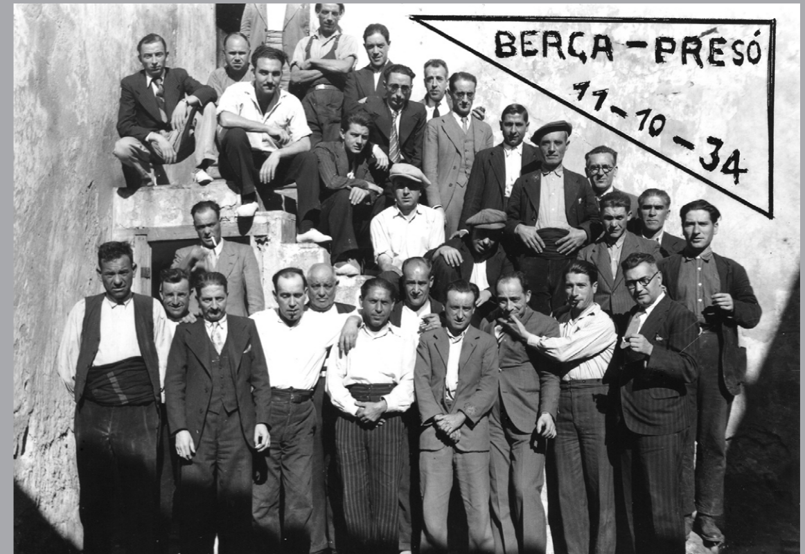
Eines per a treballs de memòria oral

"Regidors republicans de l'Ajuntament de Berga a la presó". Berga (Berguedà), 11/10/1934.