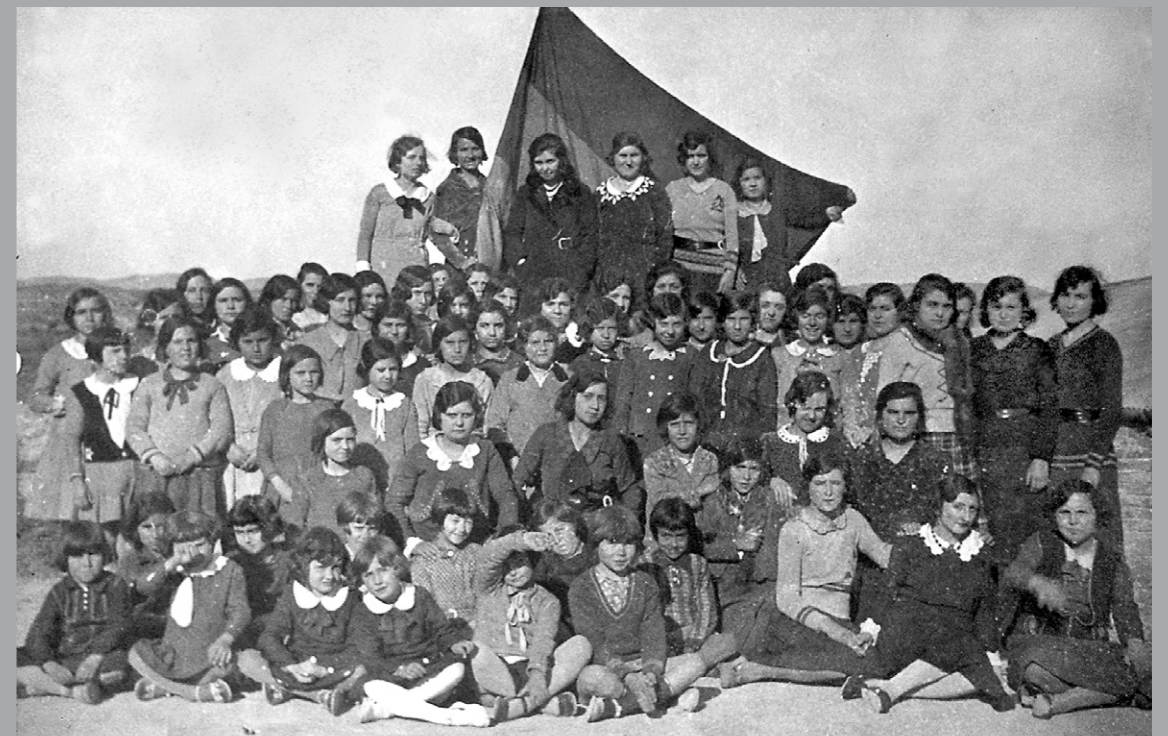
Eines per a treballs de memòria oral

Imatge: "Agrupació de noies de la Societat". Barberà de la Conca, 1932.