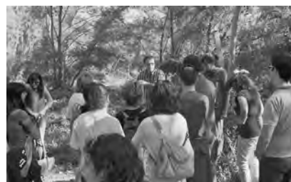
Visites i activitats organitzades pel museu.