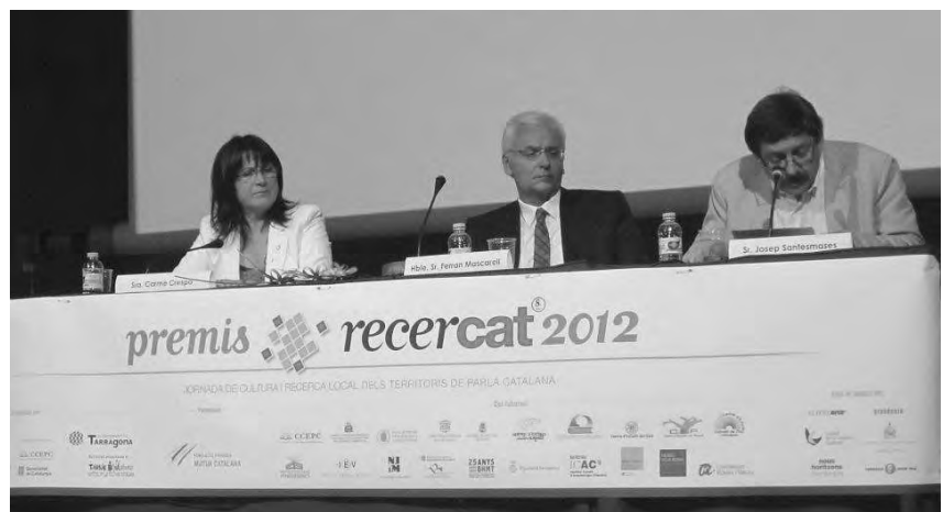
Acte de lliurament dels premis Recercat.

Totes les taules van comptar amb una important presència de públic i van