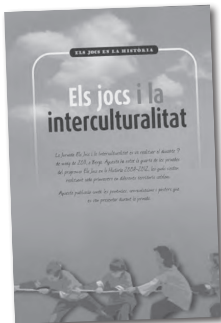
Els jocs i la interculturalitat. Institut Ramon Muntaner. (2012). 190 p.

Aquest llibre, és el quart volum de la col·lecció “Els jocs en la història” i els seus articles són les ponències, comunicacions i comunicacions-pòster que es van presentar a la Jornada