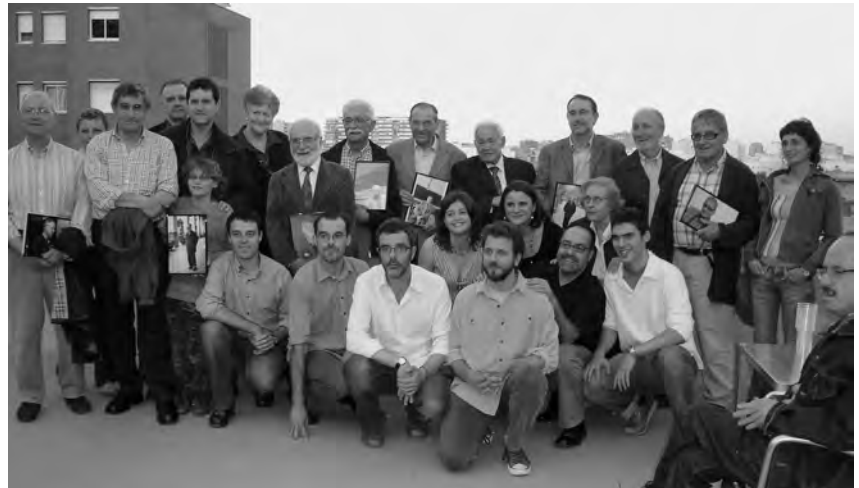
Equip de treball amb els entrevistats i les entrevistades de "Retrats per a la memòria. Persones i lluita antifranquista al districte de Sant Andreu (1939-1982)", durant la inauguració de l'exposició a la Nau Ivanow, el 30 de maig de 2008.

El projecte és un recull de setze entrevistes en profunditat a persones de diverses generacions i perfils que han configurat un exemple a seguir en les millores de la dignitat humana. Amb l'objectiu de fixar en la memòria col·lectiva el testimoni d'aquests andreuencs i andreuencques, un grup d'historiadors, periodistes i fotògrafs, 1 amb el suport del Centre d'Estudis Ignasi Iglésias de Sant Andreu de Palomar i l'Institut Ramon Muntaner, han realitzat un exercici de recuperació de la memòria històrica dels barris que conformen el districte de Sant Andreu en el transcurs del franquisme i dels primers anys de la Transició democràtica espanyola.