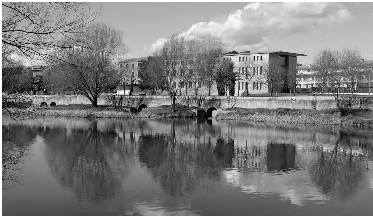
El Museu Industrial del Ter.

El Museu Industrial del Ter ocupa una antiga filatura de cotó, can Sanglas, a Manlleu. El museu està ubicat a la vora del riu Ter en un entorn fluvial privilegiat i amb àmplies zones verdes. El Canal Industrial de Manlleu recorre tota la façana fluvial de la ciutat, d'uns dos quilòmetres i finalitza el seu recorregut travessant el museu on encara avui permet posar en funcionament dues turbines a l'interior de can Sanglas.