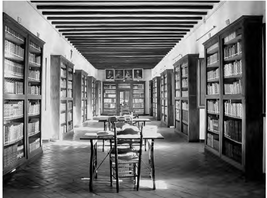
Antiga sala de consulta, al sobreclaustre de la catedral.

Un cas paradigmàtic en aquest sentit, i potser un dels més paradigmàtics, és el de l'Arxiu i Biblioteca Episcopal de Vic. L'origen de l'ABEV, pel que fa als fons arxivístics, es pot posar en els anys es que es va conformar la reorganització de l'estructura eclesial que va portar a la restauració del bisbat de Vic el 886. El fet que s'hagin conservat amb continuïtat els documents des d'aquella època implica l'existència d'una mínima organització arxivística mantinguda