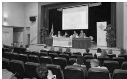
Inauguració del congrés Els jocs en la Història.

Després del Recercat el següent aparador per a la difusió i venda de les publicacions dels centres d'estudis és la Fira del Llibre Ebrenç, 2 i 3 de juny. L'estand de l'Institut acull les publica-