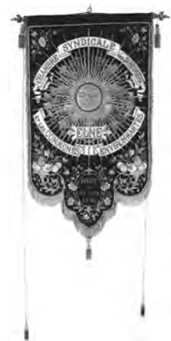
Estendard del Sindicat dels hortolans d'Elna.