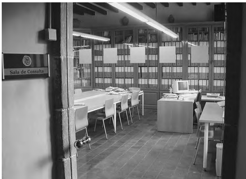
Actual sala de consulta.

nada al Capítol a mitjans del s. XIV i era aquest qui establí les escriptories als notaris i era el titular dels volums i per això el fons ha estat sempre custodiat dins l'òrbita eclesiàstica.