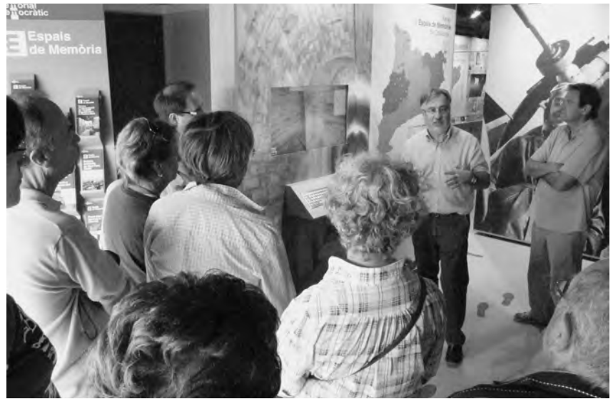
Visita al CIARGA 2012.

Sí. S'han produït canvis i en positiu. No tants com a mi m'agradaria, però avui no es pot escriure una història de Catalunya sense tenir en compte la història local. Ara per ara la relació entre la Universitat i els estudis locals és més fluïda, i això ha estat resultat d'un doble esforç: per part de la Universitat hi ha hagut un obertura territorial, coincidint amb els nous temes de la historiografia, i per part dels estudis locals s'han afrontat aquests des d'una perspectiva més general. Sovint, la història local permet aproximar-nos millor a les persones i els grups socials, a la seva realitat i comprensió del món, a la seva psicologia, a la seva cultura i, d'aquesta manera, entendre més bé com actuen i perquè actuen d'una