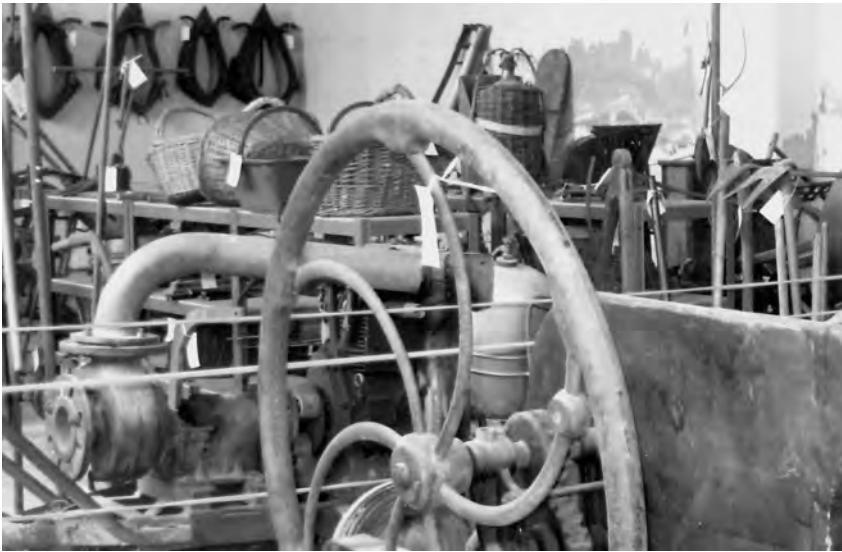
Part de les col·leccions de material agrícola al local deixat per l'ajuntament al núm. 13 de la Ronda Voltaire, al centre d'Elna.

transmetre apostant per un futur que, d'una manera o altra, hauria de ser necessàriament en part agrícola.