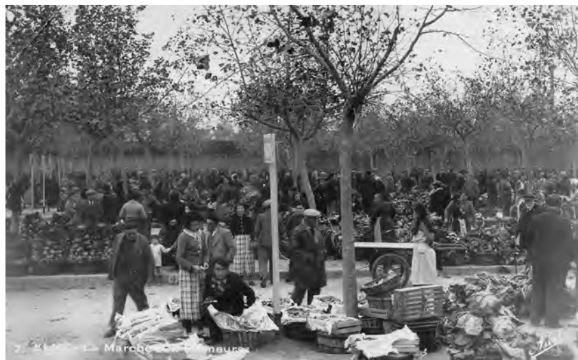
El mercat a l'engròs d'Elna durant la dècada dels anys 1930.

Aquesta presentació era necessària per entendre el perquè de la creació de l'associació Terra dels avis, un dia de 2005, quan, després de la davallada en picat de l'economia agrícola, que s'accentuà molt a partir de la dècada dels 80, i del desànim que això suposava, uns quants hortolans jubilats van decidir salvar la memòria dels seus avantpassats pagesos per poder transmetre-la en el futur i així, permetre potser la reutilització d'una experiència rica i sàvia que la modernitat enlluernadora dels supermercats i de la mundialització havia fet passar per obsoleta. Des del principi doncs, no hi havia pas únicament el desig de conservar amb una certa nostàlgia, sinó l'obsessió de