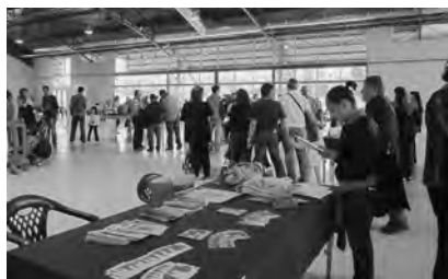
Diada de jocs i esports tradicionals.