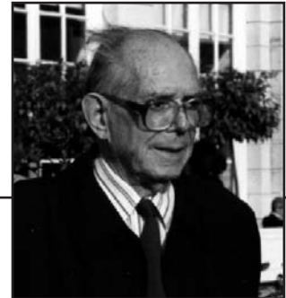
Pierre Vilar (1906-2003)

En el mateix acte, i a la mateixa Facultat de Lletres, es presentaran altres iniciatives, que també han comptat amb el suport de la Generalitat