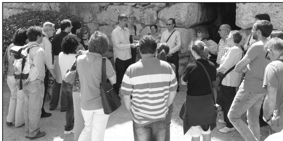
Visita per la Tarragona dels setges napoleònics.