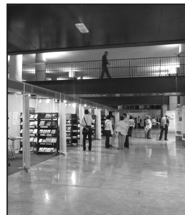
Una instantània de la Fira, al Palau Firal i de Congressos.

El dissabte al matí va tenir lloc la taula rodona "Els usos del passat", que, segurament per manca de temps, no va prendre l'enfocament que a priori podria esperar-se a partir del títol i tractant-se d'una ciutat amb un patrimoni romà de primer ordre. Tot seguit, va tenir lloc una atractiva taula rodona titulada "Associacionisme, gestió i defensa del