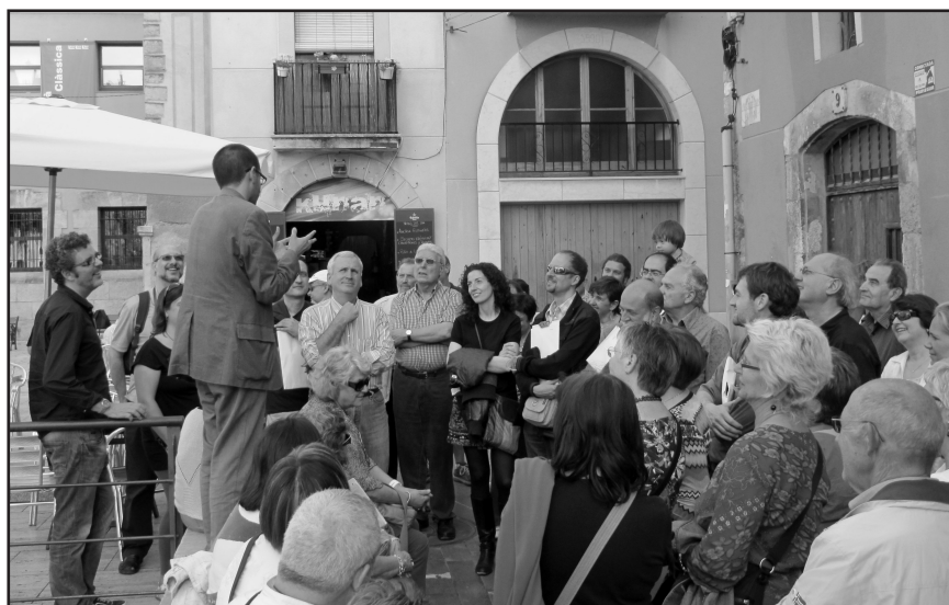
Visita per la Tarragona romana.

naturalistes, i com aquests vincles redunden en benefici de la ciutadania i de la qualitat de vida. A la tarda, van cloure la jornada un interessant diàleg a propòsit de les particulars experiències vitals entorn del món agrari viscudes per l'escriptor Joan Rendé i el periodista Lluís Foix i una anàlisi –més sociològica que no pas històrica– de les transformacions viscudes en el món rural al llarg dels darrers cinquanta anys.