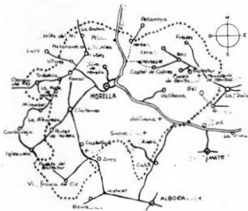
Croquis dels pobles als que fa referència el Monogràfic

Els pobles els fan la gent que viu i treballa en ells i actualment als nostres pobles es viu relativament bé, malgrat el fet de continuar amb problemes de comunicacions, treball, d'equipaments i