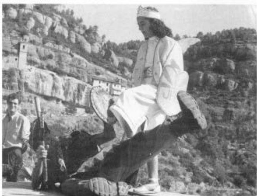
Després d'una xerrada del dimoni, surt un àngel que el derrote