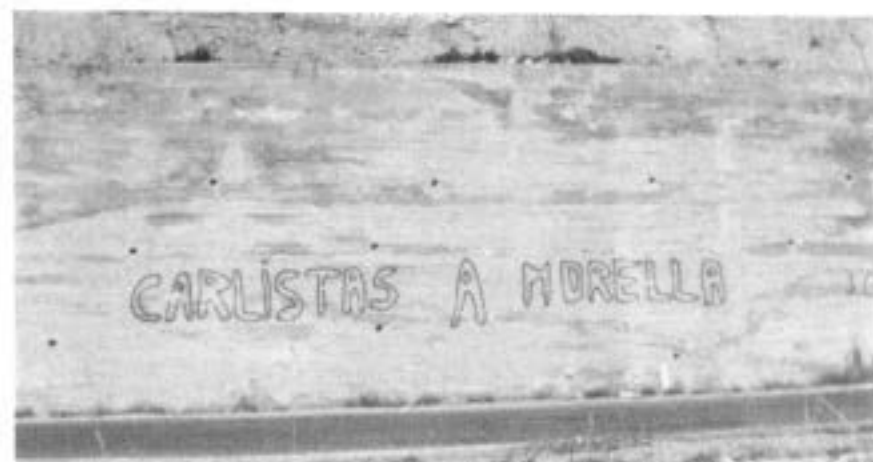
Pintada al mur del Collet d'en Belleta.

En resum, un carlisme adequat a la realitat sociopolítica espanyola, però incapaç d'arrossegar i transmetre el seu missatge a bona part del poble treballador, encara que havia defugit ja d'aquells plantejaments integristes partidaris «de una regència presidida por el arzobispo de Toledo, asesorado por el Justicia Mayor del Reino y por el presidente de las Conferencias de San Vicente Pauls».