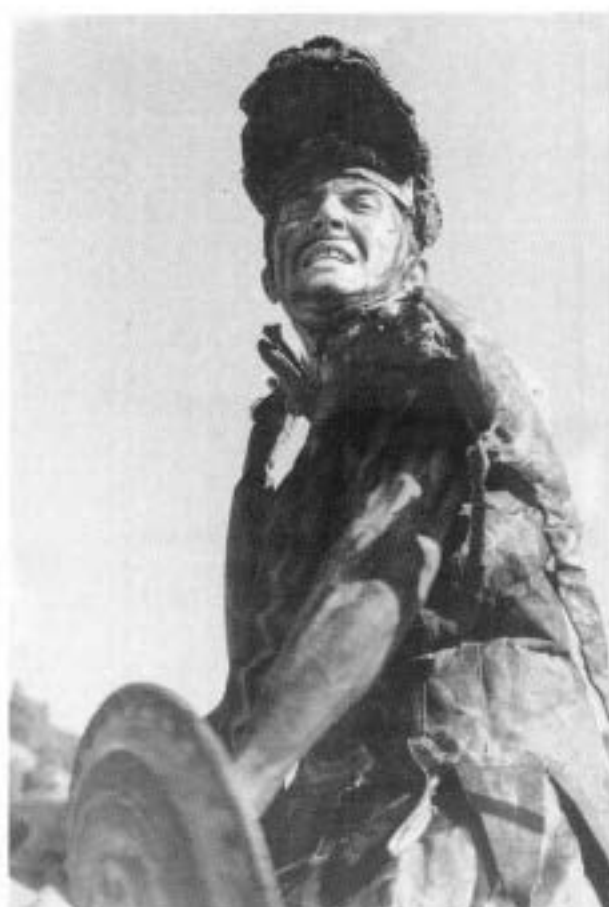
...Ix el dimoni amb la idea de parar-les