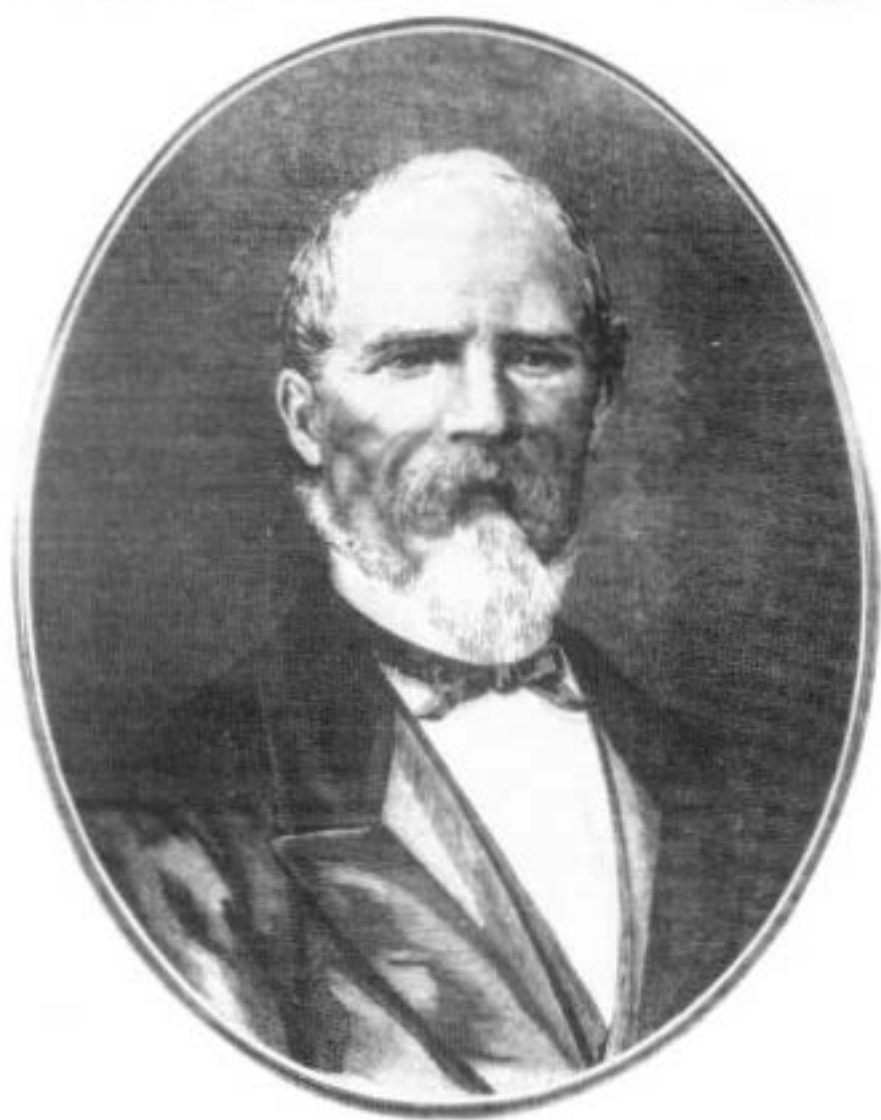
Reproducció d'un gravat, retrat de Ramon Cabrera en els seus últims anys quan residia a Wentworth

De 1833 a 1838 va intentar fer, de les espontànies partides, un exèrcit mínimament professionalitzat. Va arribar fins Andalusia. En el decurs