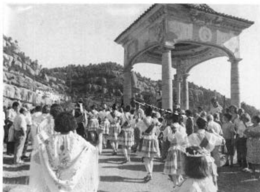
Les danses i la comitiva comencen la pujada fins l'ermita