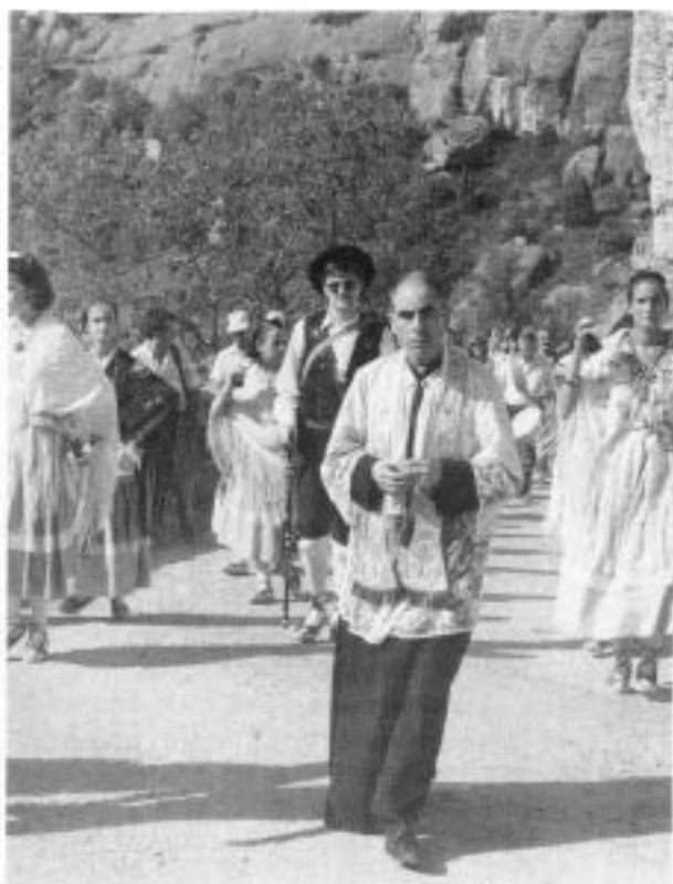
Finalment la comitiva continua la pujada fins l'ermita, on es celebra una missa solemne