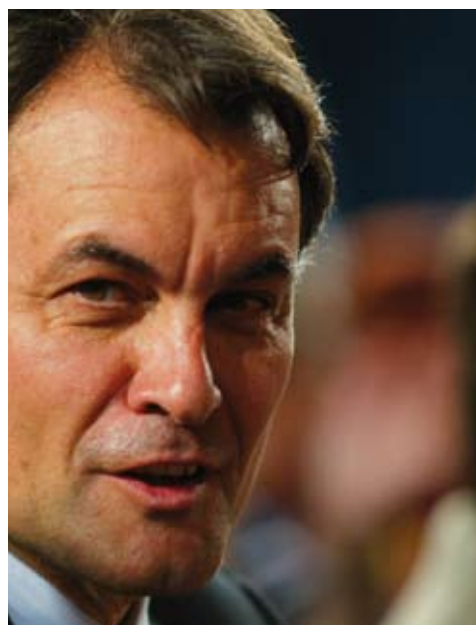
Artur Mas, president de CIU i secretari general de CDC:

Aquesta confiança també ens fa defensar que administració pública i societat civil treballin de la mà, que col·laborin i actuïn coordinadament, i allà on no arribi una, hi arribi l'altra. Lluny de l'obsessió de fer arribar l'administració a tot arreu, per què