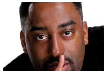
Miquel Àngel Ripeu és conegut per les seves actuacions a la televisió