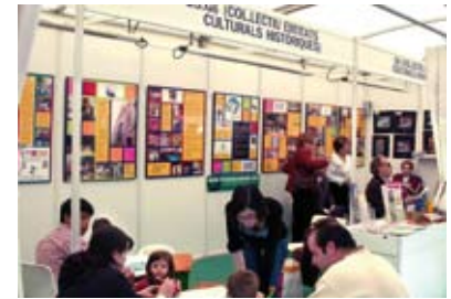
Estand conjunt del G6 a la mostra d'entitats