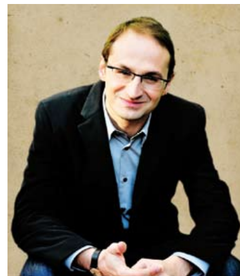
Joan Herrera, secretari general d'ICV-EUiA:

Una peça clau d'aquest reconeixement, protagonisme i impuls dels serveis i equipaments de l'associacionisme ha de ser la incorporació en el desplegament del PECCat del patrimoni immoble d'arreu del territori propietat de les entitats. Tots aquests compromisos i projectes necessiten d'un espai estable i formal per treballar, compartir i concretar els reptes de futur. Us renovo el compromís d'ICV-EUiA.