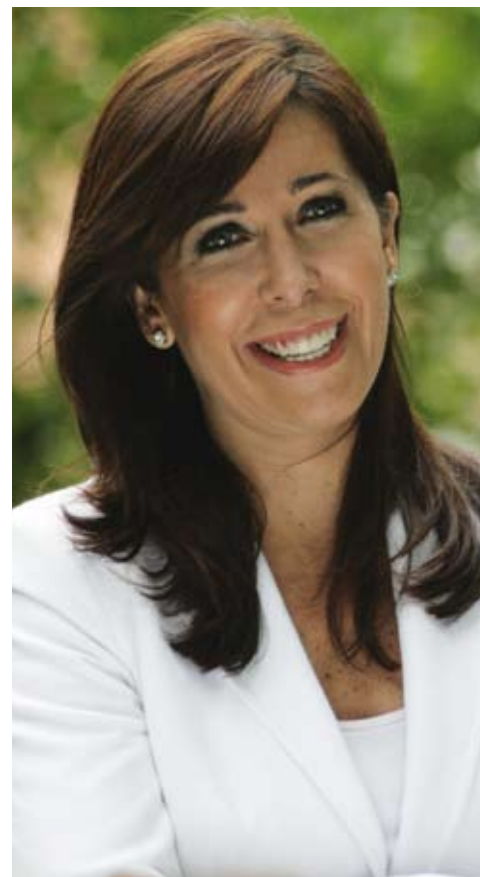
Alícia Sánchez Camacho, presidenta del PPC:

La redacció del PECCat no ha tingut en consideració tota la xarxa i el potencial cultural català. Els ateneus han quedat exclosos, com han quedat excloses, per exemple, moltes sales privades de música.