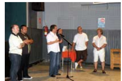
Sopar conjunt de juntes del G6