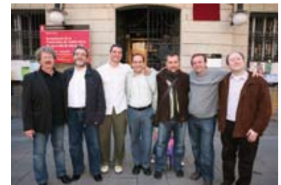
Membres del G6