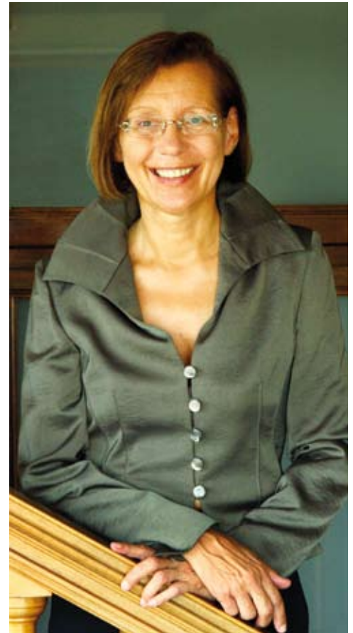
Montserrat Tura, secretària de Cultura i Audiovisuals del PSC:

L'Administració autonòmica s'haurà de plantejar el repte d'aprovar un pla que permeti donar compliment a les normatives d'accessibilitat, seguretat i mesures contra incendis. (...) Cal recuperar el Pla d'ateneus que es va impulsar durant el mandat 2003-2006.