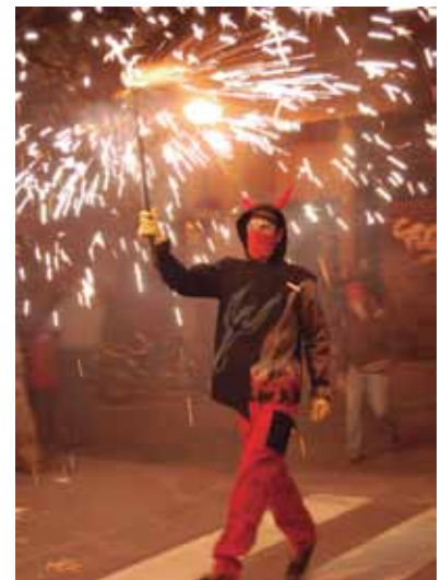
Imatges dels Diablers i Tabalers del Clot i del la imatgeria festiva.