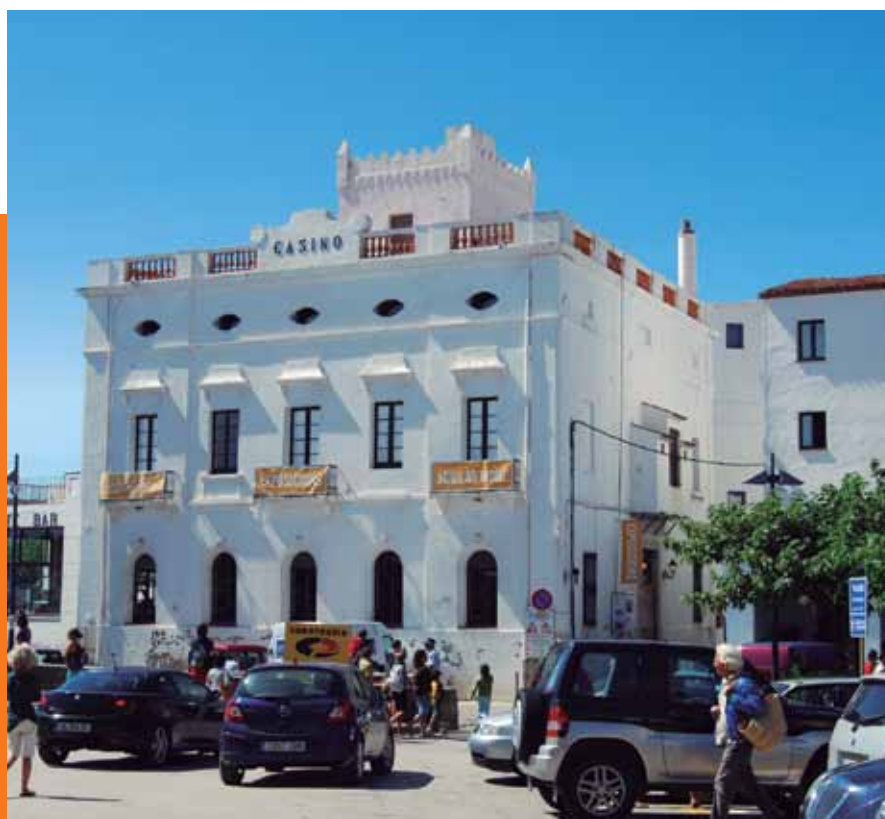
(A dalt) Imatge de La Concòrdia de Cantallops