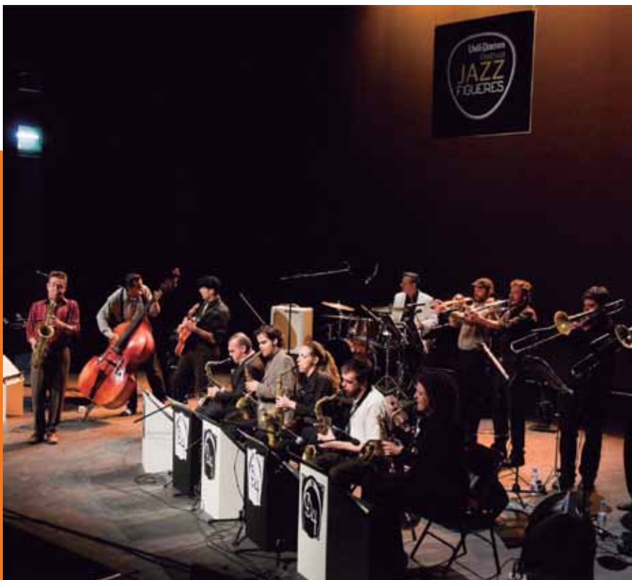
Festival de Jazz organitzat pel Casino Menestral a la sala de teatre de La Cate

En aquella mateixa època també va néixer el Casino Menestral Figuerenc (1856). Dividida en quinze seccions destinades a diversos àmbits de l'art i la cultura, l'entitat va esdevenir el principal centre de vida social de Figueres i de tot l'Empordà. La cultura en tots els seus aspectes i l'atenció lúdica dels seus associats eren els pilars del nou casino, fet que no va canviar fins ben entrada la Guerra Civil.