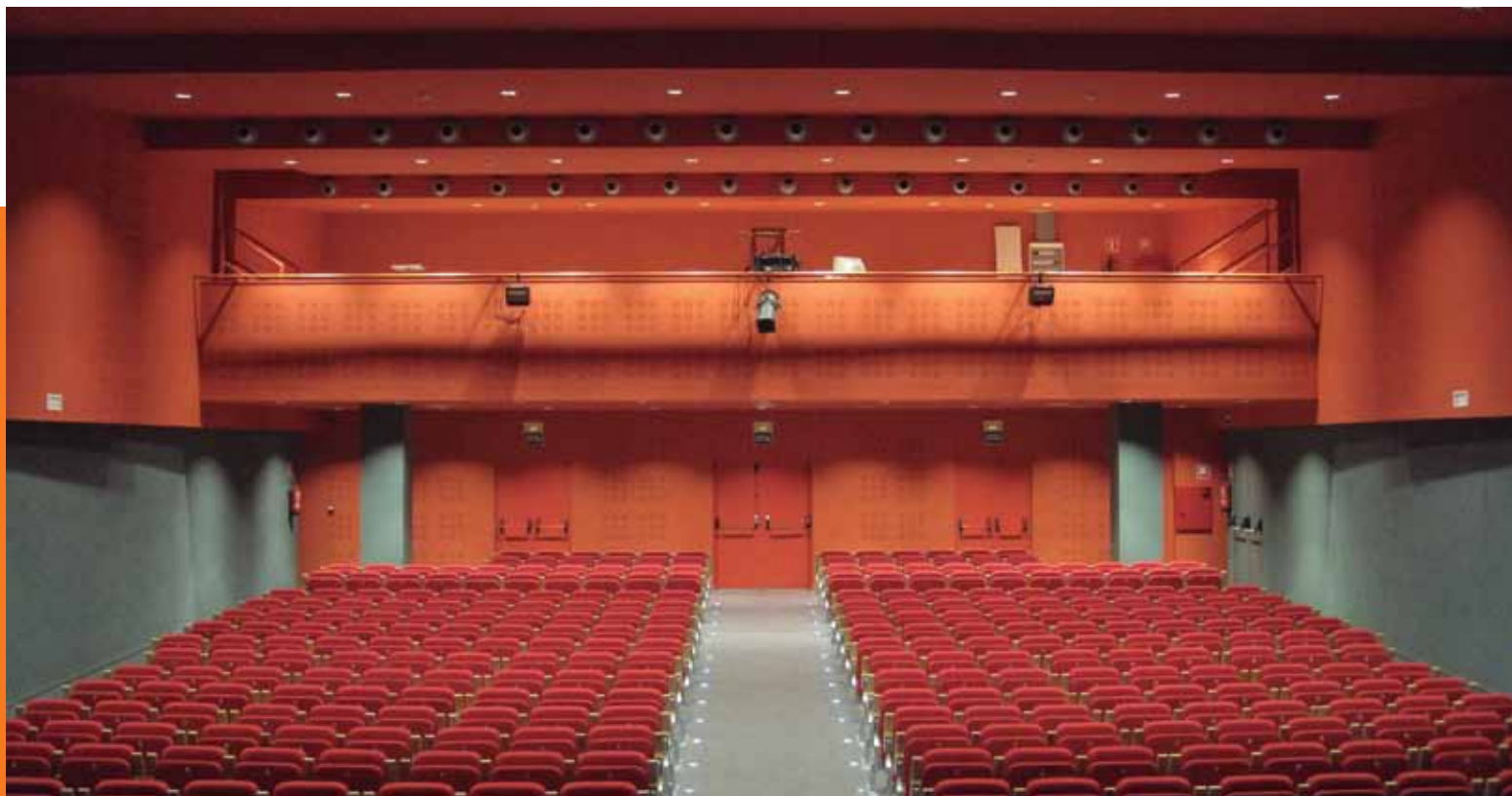
Teatre del Patronat de la Catequística La Cate de Figueres

El nord-est de Catalunya acull una terra dividida en dues comarques, l'Alt i el Baix Empordà, les quals es caracteritzen per un posicionament geogràfic amb dos elements que configuren el seu paisatge i la seva història: el mar Mediterrani i la serralada pirinenca.