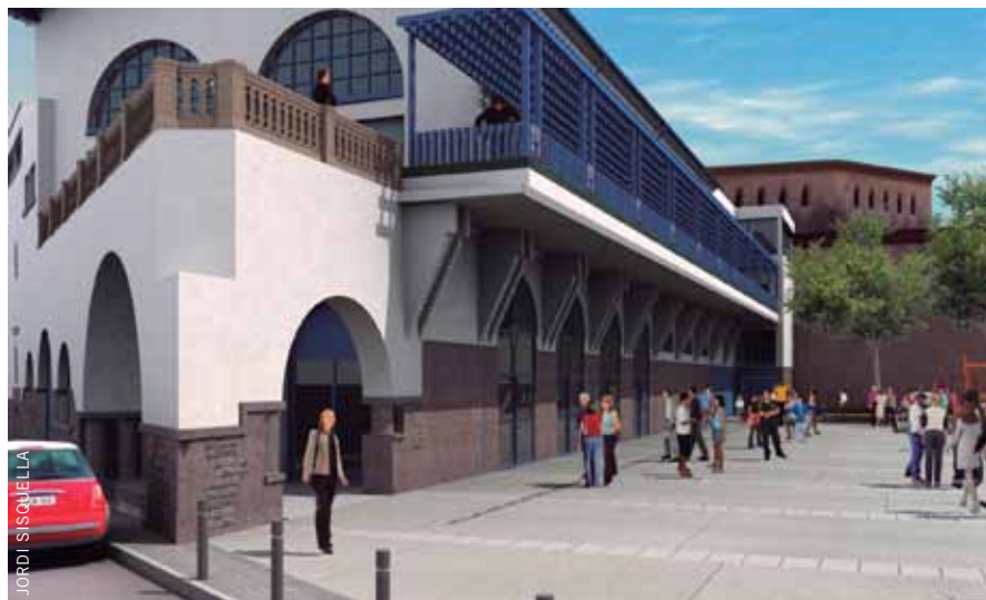
Reproducció virtual del nou Odeon.