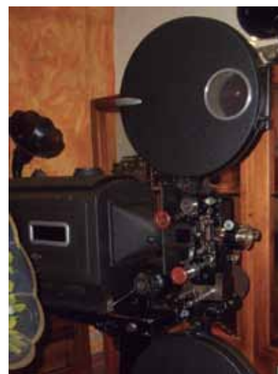
Imatges de l'Ateneu de Lavern i del projecteur abans i després de ser restaurat.