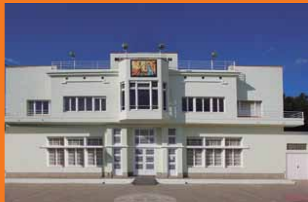
(A dalt) Casino La Constància, conegut popularment com el Casino dels Nois (A sota) Façana de La Cate de Figueres