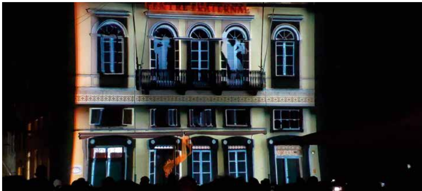
El mapping que es va projectar a la façana del Centre