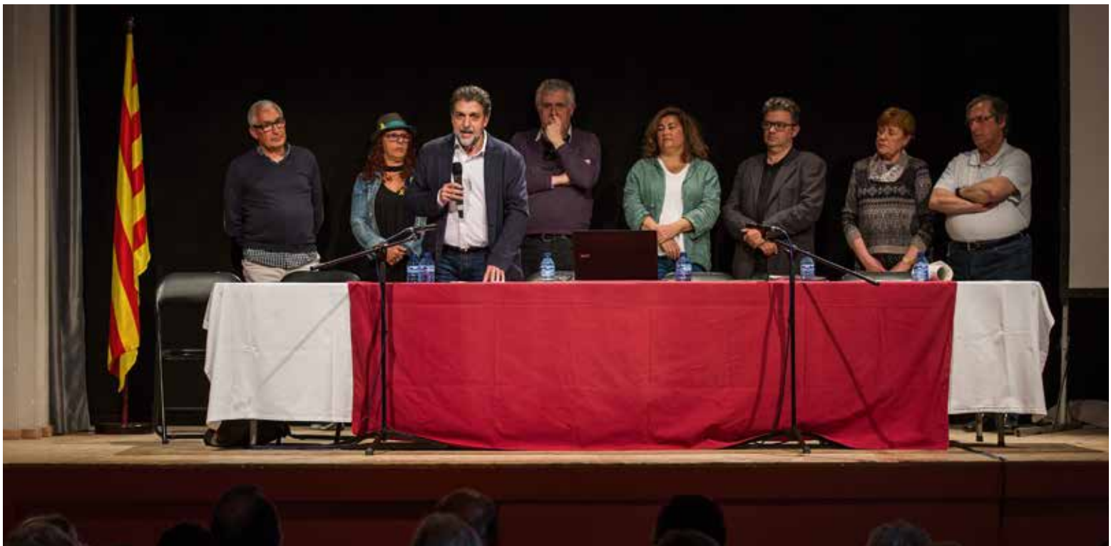
Els nous membres de la junta directiva de la Federació d'Ateneus

També és delegat territorial de la FAC a la ciutat de Barcelona.