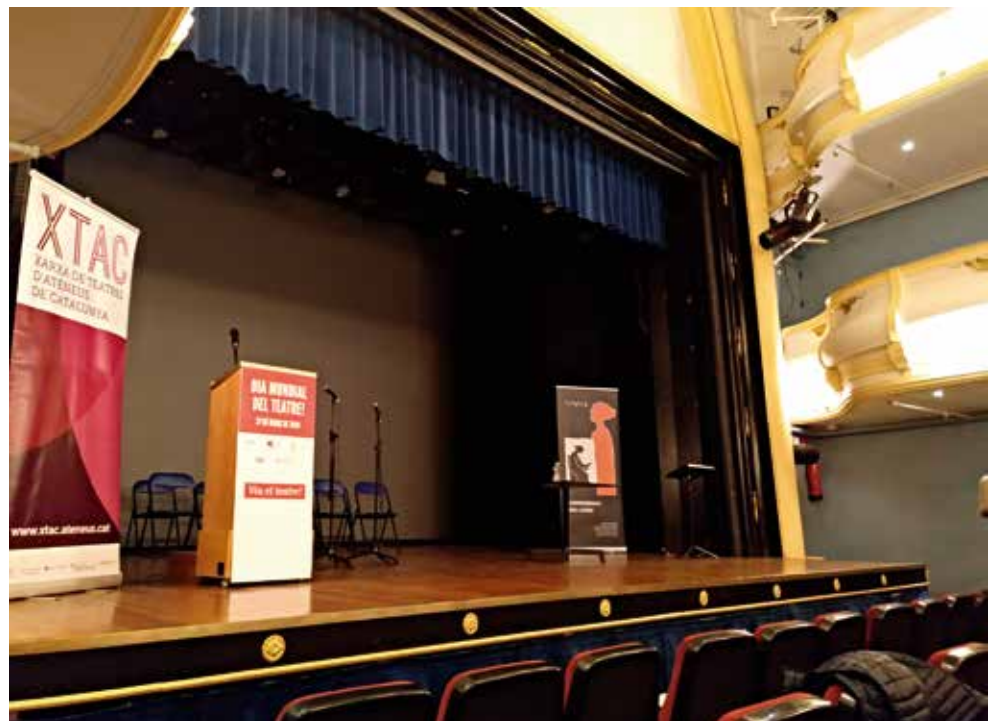
El teatre del Centre Moral, abans de començar la celebració del Dia del Teatre

manera de fer. Teatre en totes les expressions possibles, amb nenes i nens, gent gran, però, sobretot, amb la diversitat de gèneres, des del musical fins al teatre de text. Autèntics professionals de l'art de Talia han començat als nostres centres en el món de la interpretació. Quin ateneu no fa alguna cosa al·legòrica per Nadal, el que sigui, però sempre dins d'una rigorositat genial. Heu pensat alguna vegada com hauria estat la nostra societat, sense aquesta capacitat creativa i artística, i aglutinadora, que han tingut sempre al llarg de molts anys els nostres ateneus? Pensem una mica.