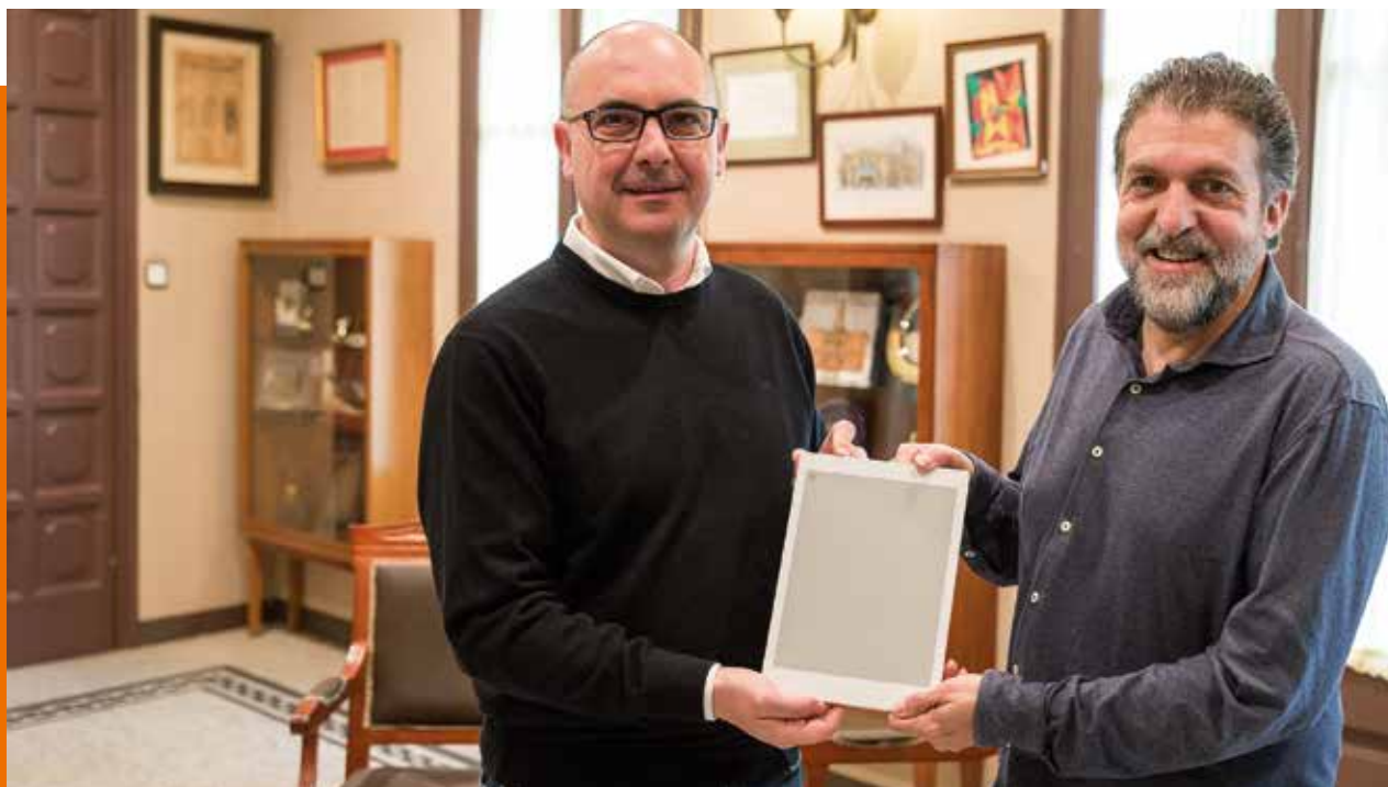
Com pertoca al segle XXI, tots dos presidents fan el traspàs -també simbòlic- amb una tauleta