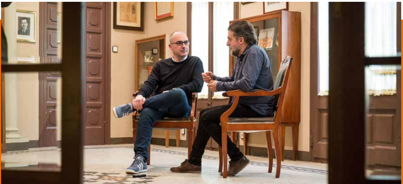
Des de fora, espiem la conversa dels dos presidents de la FAC

En molt poc temps vam tenir la sort de poder identificar aquests factors: que la Federació havia d'oferir serveis als ateneus, que havíem de fomentar el treball en xarxa, i que havíem de defensar els interessos del col·lectiu. En haver identificat aquests eixos en el nostre pla d'acció va ser quan vam poder començar a desenvolupar tota la feina. I a partir d'això comences a ser visible, aleshores et comencen a tenir en compte i a partir d'aquí comences a participar en més fòrums, on trobes més gent, aquesta et condueix a més llocs, i és una roda que comença a caminar, a agafar forma i volum, i ens porta fins on hem estat ara. Si la Federació hagués quedat tancada en ella mateixa, només pensant que el que feia ho feia molt bé, que qui potser no ho entenia era la resta del món, no hauríem avançat com ho hem fet. Sempre ens hem qüestionat el que estàvem fent i sempre hem intentat identificar en què podíem ajudar.