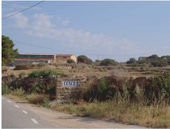
ZONA A : terrenys on s'ha de construir la variant