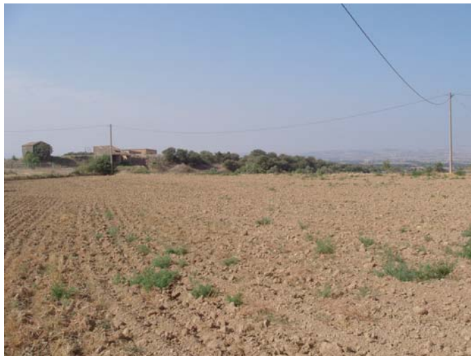
ZONA A : terrenys llaurats per on passarà la variant