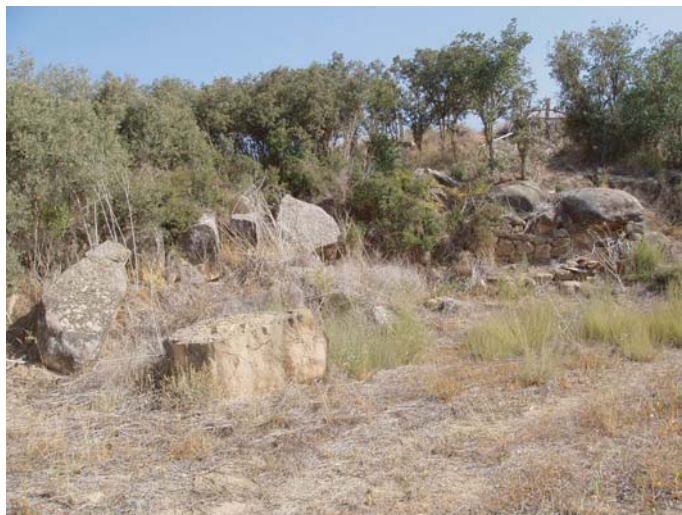
ZONA A : petites balmes i fragments de roca