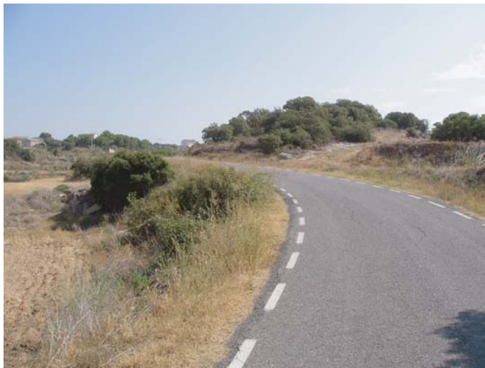
ZONA B: punt d'ampliació del camí asfaltat