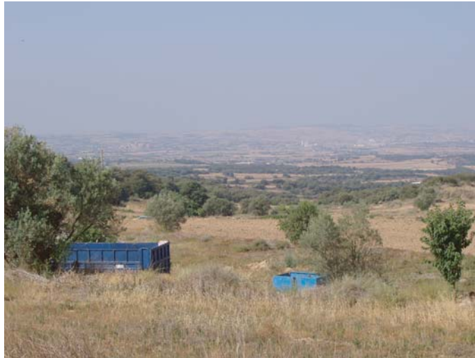
ZONA A : terrenys on anirà la nova variant