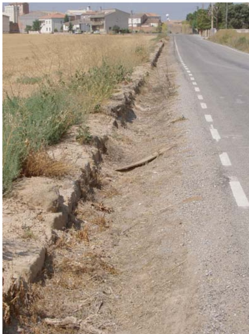
ZONA C: mur del camp de conreu paral·lel al camí asfaltat