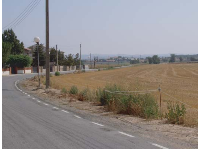
ZONA C : tram on s'ampliarà el camí