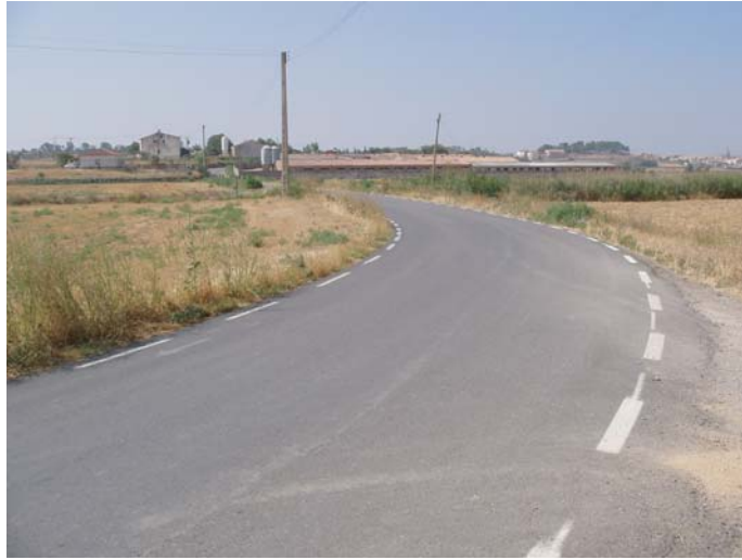
ZONA C: tram on s'ampliarà el camí