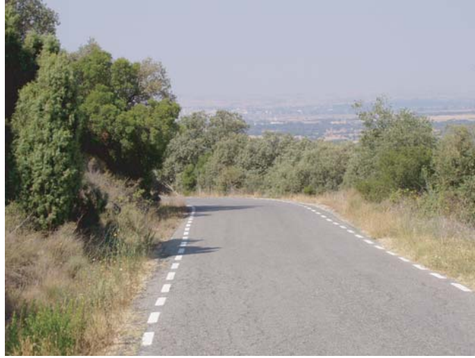
ZONA B: punt d'ampliació del camí asfaltat