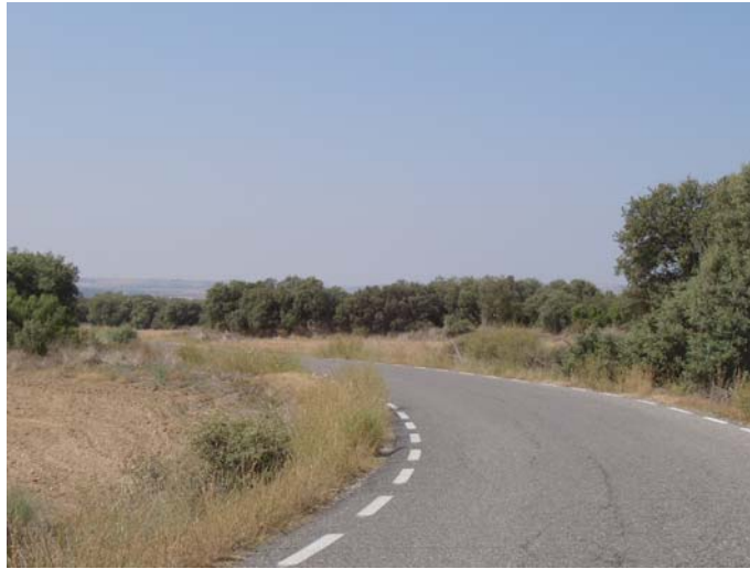
ZONA B: punt d'ampliació del camí asfaltat