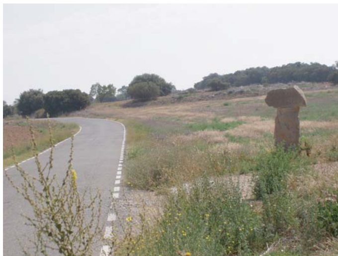
ZONA B: punt d'ampliació del camí asfaltat a prop del jaciment dels Arquells