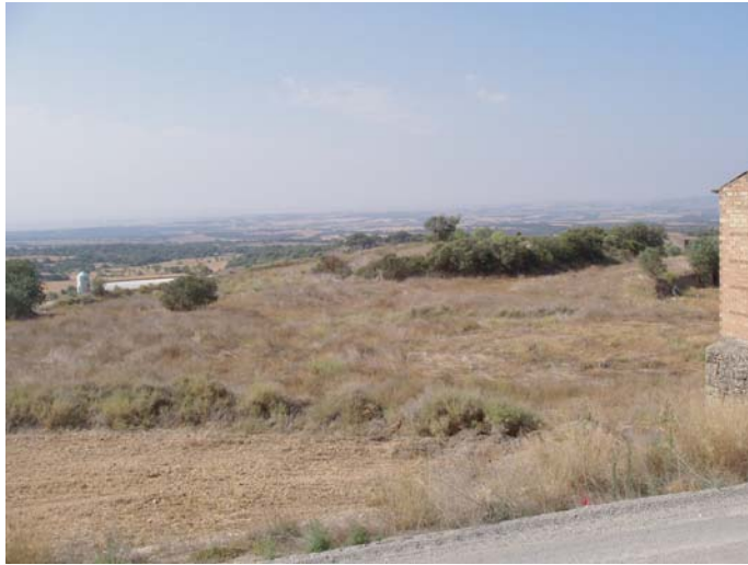
ZONA A :zona on la variant s'ajunta amb el camí existent