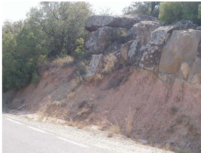
ZONA B: punt d'ampliació del camí asfaltat