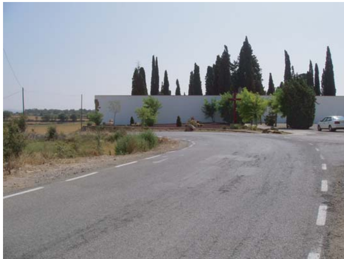
ZONA C : tram on s'ampliarà el camí