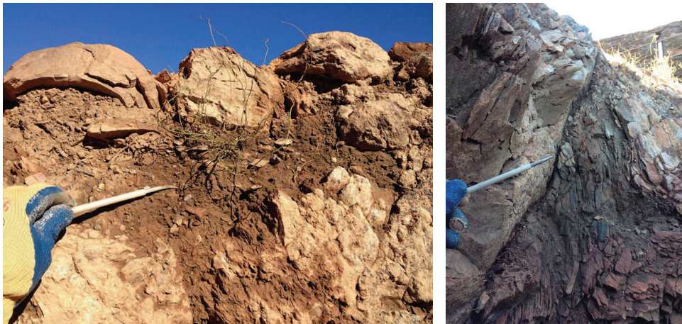
Procés de neteja, eliminació de terres.