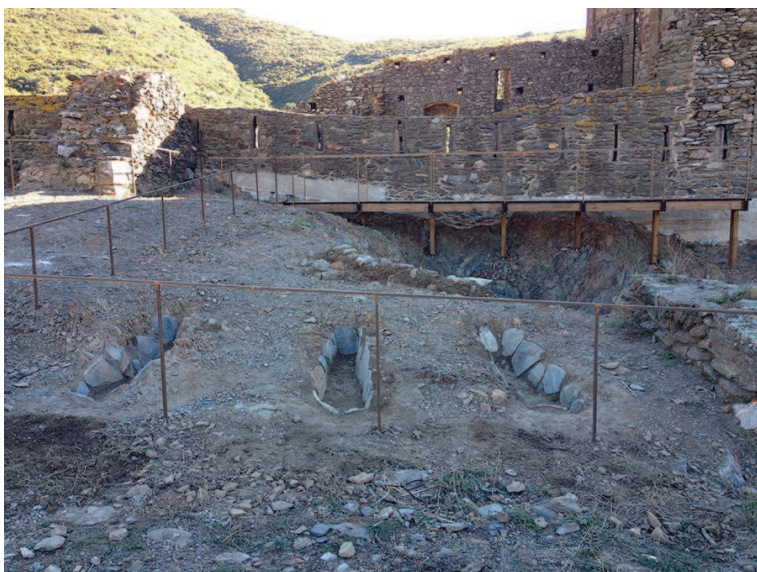
Vistes individuals i generals de les tombes després de la intervenció.