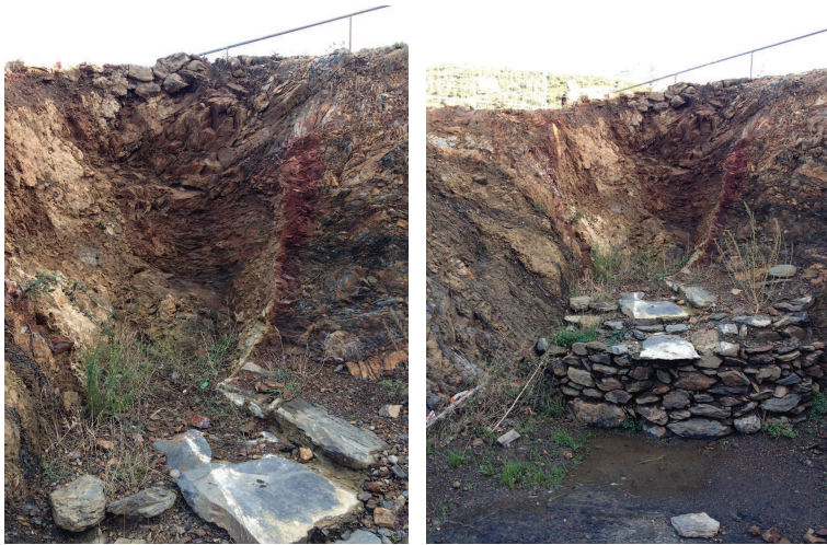
Estat inicial de les restes arqueològiques del forn de calç.