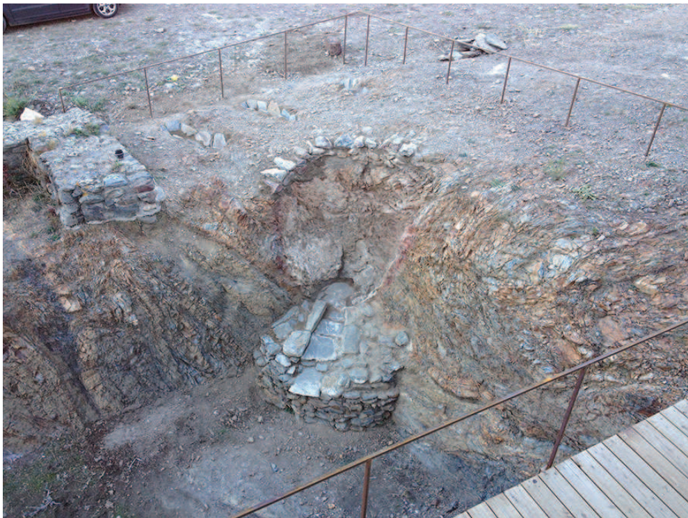
Estat final després del procés d'intervenció.