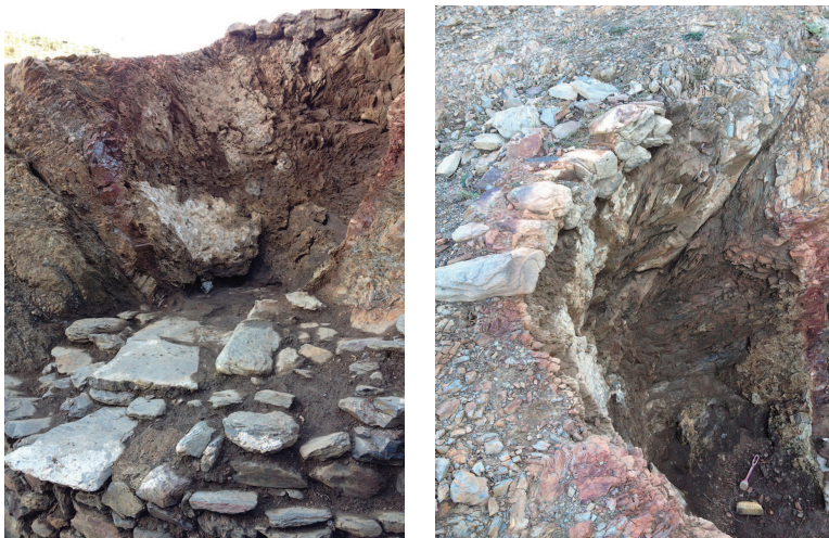
Finalització del procés de neteja.