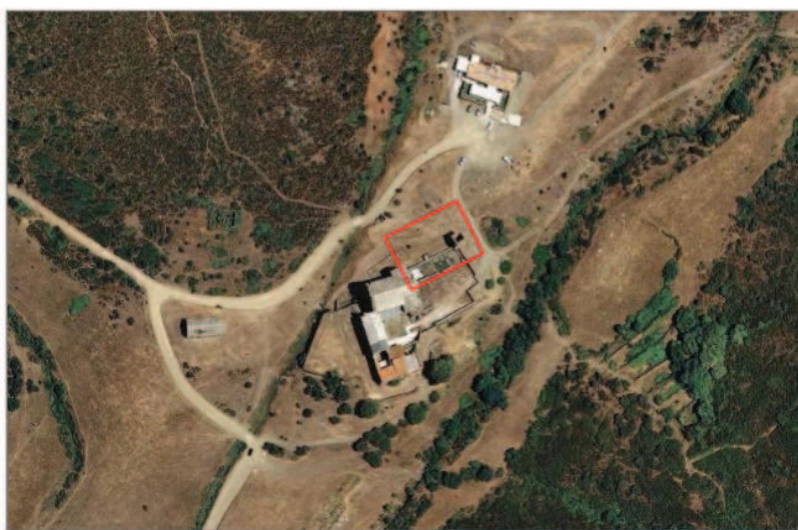
Plànols de situació i fotografia de la zona on es localitzen les estructures arqueològiques intervingudes.