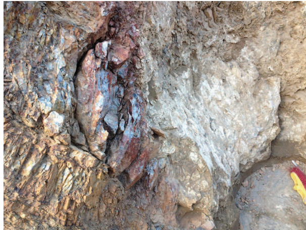
Injecció de morters líquids a les fissures de la roca mare.