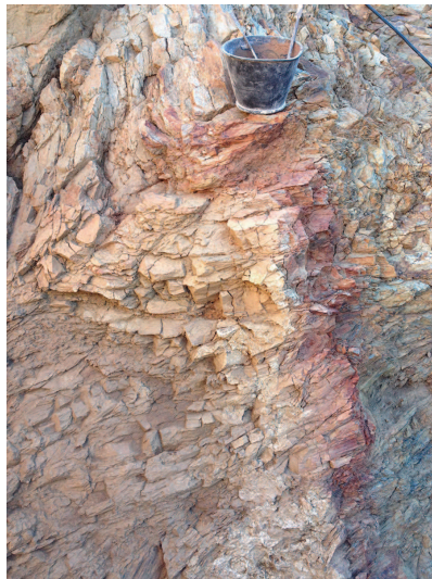
Reintegració d'esquerdes i fissures de la roca mare.