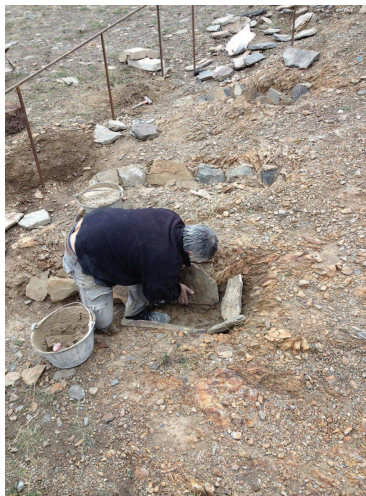
Reintegració/reconstrucció de les tombes.