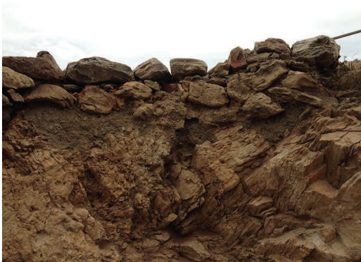
Reintegració/reconstrucció de la obra original.