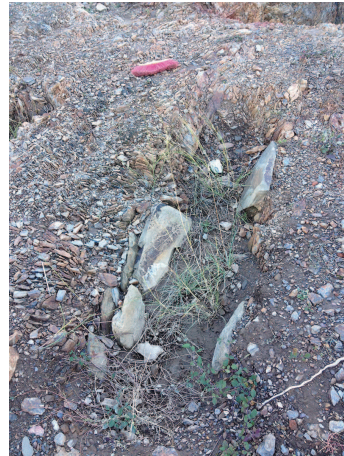
Estat inicial de les tombes antropomòrfiques. Vistes general i individuals de les tombes 1, 2 i 3.