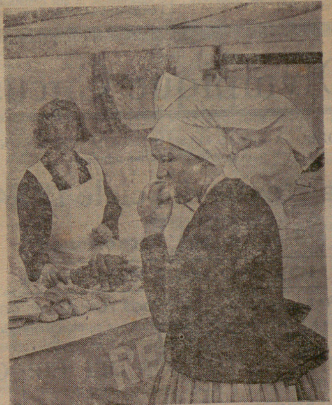
FIRA DE PRIMAVERA A SPREWALD (PRUSSIA) Una salsitja calenta i un tros de pa són de bon menjar després d'una dura jornada de treball, bo i conversant amb les xicotetes del poble on se celebra la fira de primavera a Kottbus prop de la riba del Spre.

El recurs contra la llei de contractes de conreu: Problemes que planteja NO HI MANQUEU!