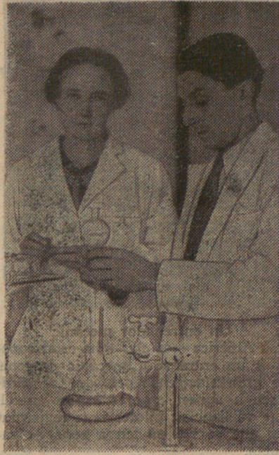
ELS SUCCESSORS DELS ESPOSOS CURIE

dre-ho tot o guanyar-ho tot. La sola possibilitat que el poder caigui a mans dels enemics declarats de les essències del règim, posa al roig viu els ànims dels republicans dignes i, sobretot, els ànims de les masses proletàries, les quals tenen perfecta consciència del negre esdevenidor que se'ls espera, si Gil Robles aconsegueix introduir-se als llocs estratègics de l'Estat. Els perills són tants i tan intensament carregada es troba l'atmosfera política, que no és aventurat de dir que a l'hora de la publicació d'aquestes ratlles pot haver esclatat ja la tempesta. D'error en error, de claudicació en claudicació, vet aci on han anat a parar les il·lusions de llibertat i justícia que el poble tenia posades en la República. Però, encara és hora de jugar-nos el tot pel tot. Contra la reacció, contra els traïdors, tot sacrifici és poc. Atenció a la marxa dels esdeveniments, i disposats al que calgui!