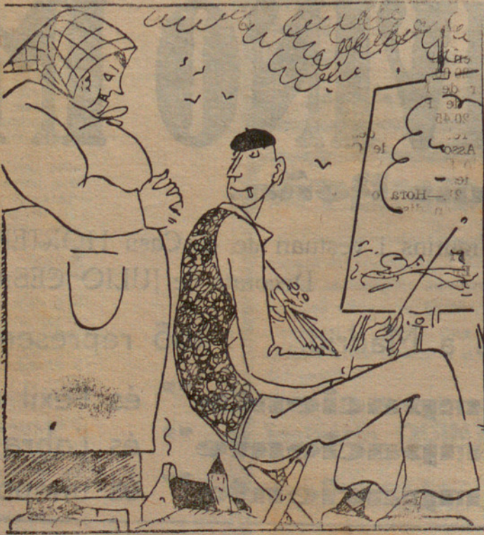
—Li agrada la pintura? —No n'he menjat mai.