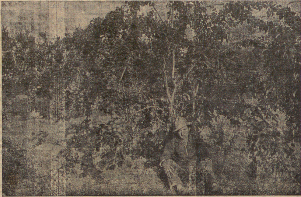
Fotografía de un Albaricoquero. Variedad de Alejandria. Injerto de 3 años.

Catálogo general explicativo a cuantos lo soliciten. Cabezas, Tubérculos y Bulbos de flores en general.