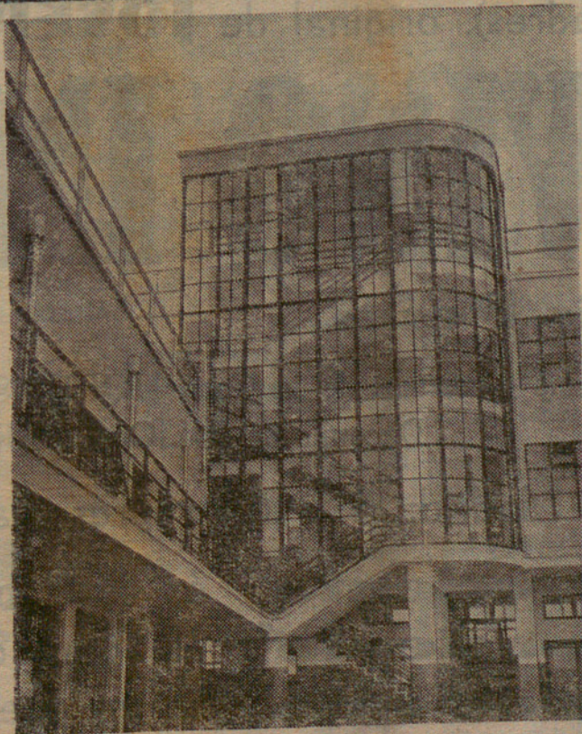
UN MODERN PALAU-ESCOLA

Però per trobar aquesta sortida cal conèixer quina és la dificultat. Hom s'esfonzará més i més en el toll, i es caminarà vers una catàstrofe si hom s'obstina en creure que es pot fer avui a Europa una política d'equilibri i de pau com es podia fer abans de l'any 1914, quan no hi havia a Europa sinó Estats regulars i legítims, suposant que la situació interior gairebé desesperada d'Itàlia i d'Alemanya és un