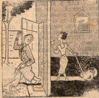
Els nous casats

—Tu, videta meva, treu la pols, que jo tallaré l'herba del jardí.