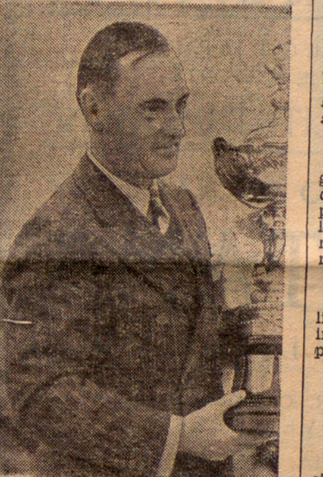
MALCOM CAMPBELL BAT EL SEU PROPÍ RECORD

COLISIO COMUNISTA Sofía, 4. — En los alrededores de Haranly, con motivo de una comisión entre gendarmes y comunistas ocurrida en una montaña próxima resultaron cuatro comunistas y dos gendarmes muertos.