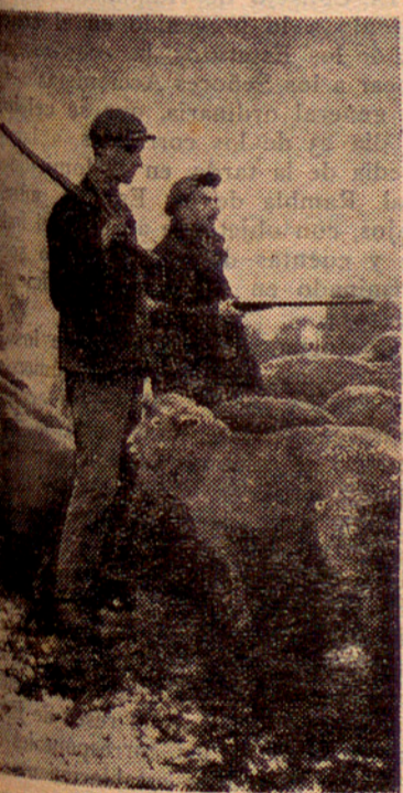
PASTORS AMB ESCOPETES

A Anglaterra s'acaba d'esvaïr la llegenda de la pau i serenor que evocuen els pastors. La poesia bucòlica acaba d'ésser convertida en una estampa fèrrea. Els pastors s'han vist obligats a armar-se d'escopetes per tal de defensar els ramats dels malfactors