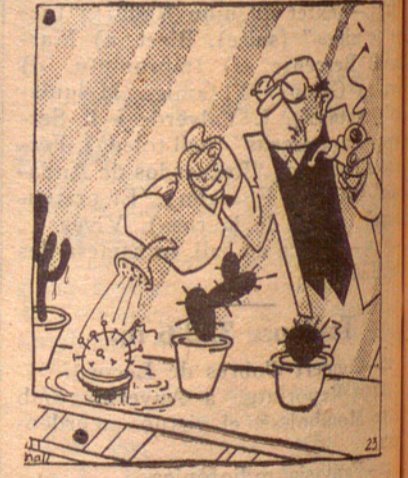
El miop aficionat als cactus

G. E. i E. G. — El propinent diumenge, a les 10 del matí, tindrà lloc en el camp de Les Pedreres, l'anunciat matx d'atletisme entre el Junior F. C., de Barcelona, i el G. E. i E. G. Entre els elements del Junior F. C. figuren l'equip campió de Catalunya de 4 X 100 i el notable rècordman de llançament de pes i disc, en Pere Ricard. S'efectuaran les següents proves: Pes, salt d'alçària, 80 m., disc, 90 m., salt de llargària, 600 m., perxa, 3.000 m., martell i 4 X 100.