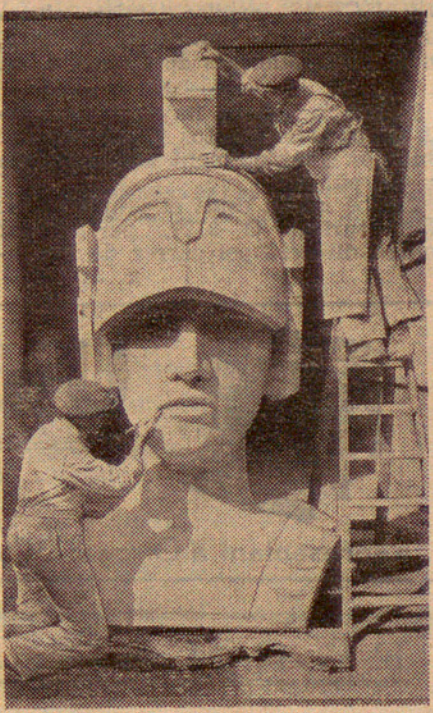
El jubileu d'Anglaterra

Era que anava comprenent-lo, sentint, a poc a poc, cada vegada més. No sentia en aquells moments altre il·lusió que aquell llibre, i per ell eren moltes les vegades que em deixava perdre un bon partit de futbol, una excel·lent vetllada de cinema, etc.